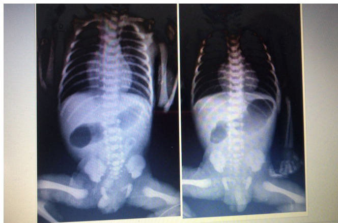
Figura 1: Radiografia simples de abdome com sinal de dupla bolha

Em alguns casos a membrana duodenal pode ter um pertuito, sendo então a manifestação clínica de suboclusão duodenal, com diagnósticos diferenciais de pâncreas anular e vício de rotação intestinal, e não de atresia duodenal. Relatamos a evolução de um paciente com membrana duodenal com manifestação atípica.