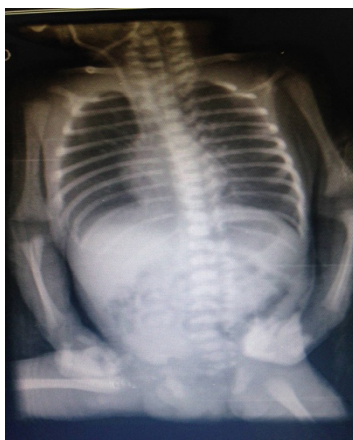
Figura 2: Paciente evoluiu bem, sem sinal de dupla bolha em raio X pós-operatório

No PO2 paciente evoluiu com sepse de origem pulmonar, respondendo bem após modificação da antibioticoterapia. Iniciou dieta oral no PO13, NPP suspensa no PO16 e alta hospitalar no PO23.