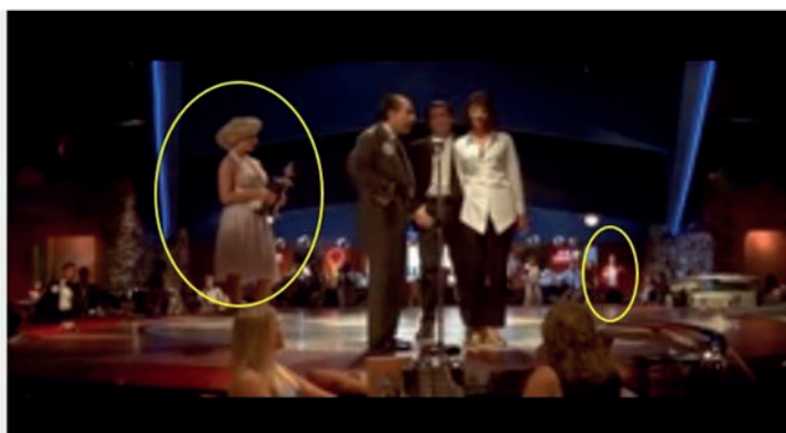
Figura 3 - Cena do Concurso de Dança em Pulp Fiction

A sequência da dança é protagonizada pelos atores John Travolta e Uma Thurman, interpretando respectivamente Vincent Vega e Mia Wallace, a locação é o clube Jack Rabbit Slim's – um restaurante temático que tem como empregados sócias de ícones pop (detalhe para Marilyn Monroe e, ao fundo Michael Jackson, na imagem abaixo), montá-lo foi um dos maiores custos de produção do filme, motivo pelo qual Tarantino teve que cortar em outras áreas – e a ação é a participação do casal em um concurso de dança.