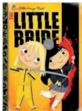
Figura 2 - Livro infantil baseado em oteiros de Tarantino