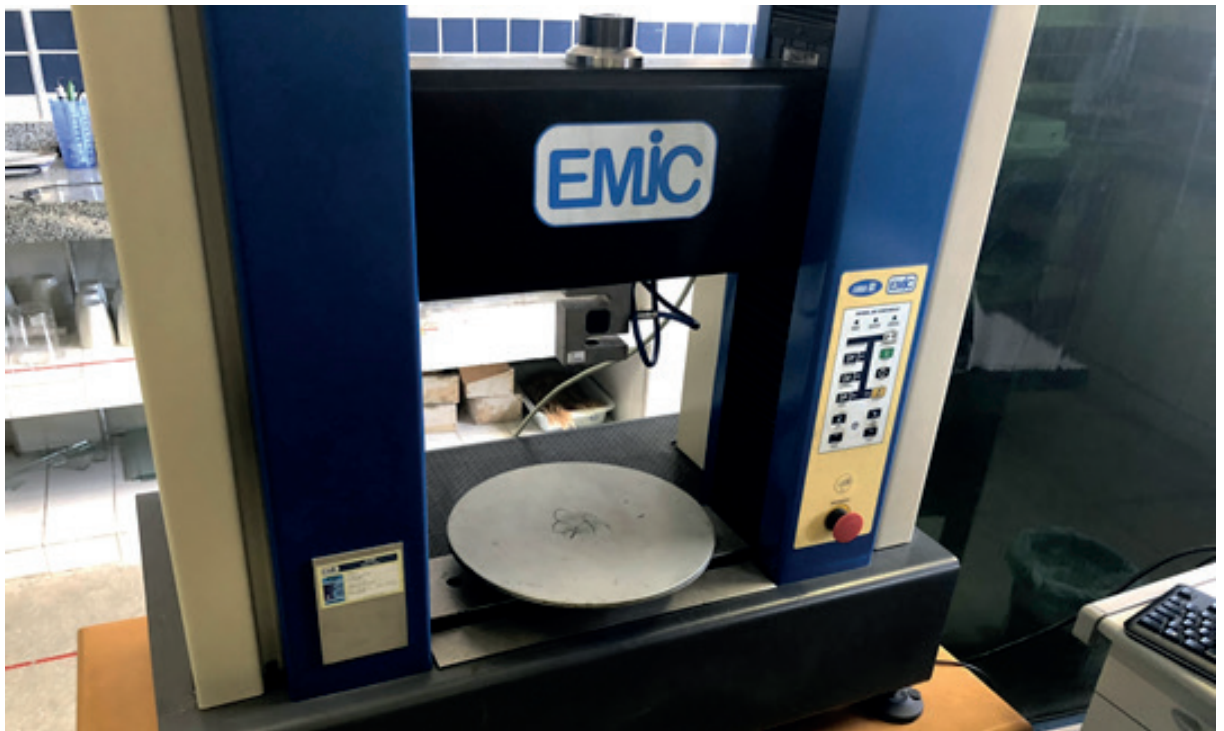
Figura 1 - Máquina de Ensaio Mecânico Destrutivo (EMIC®) – Juazeiro (BA), 2018.