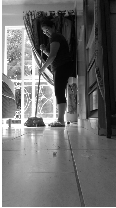
Fig. 6. Registro fotográfico de um estudante para a exposição “Mulheres extraordinárias