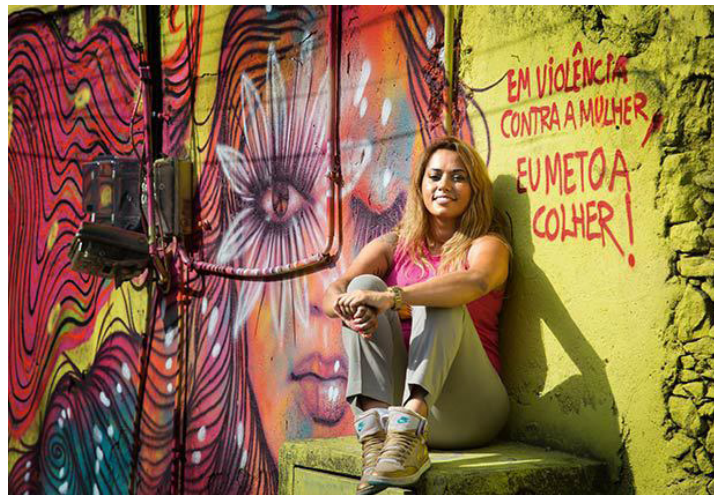
Fig. 9. Grafite apreciado da artista Panmela Castro