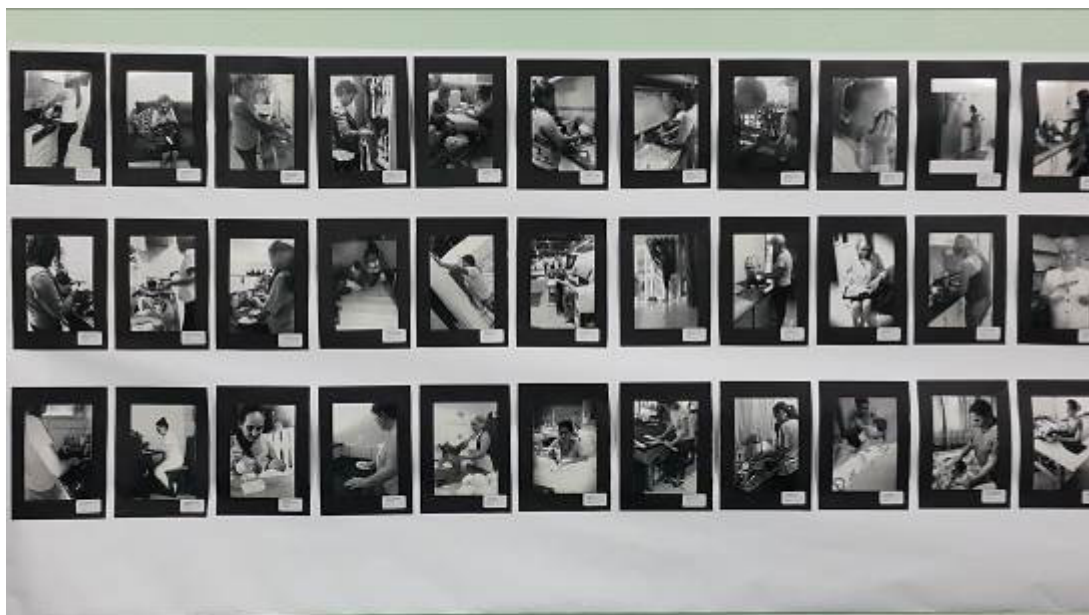
Fig. 4. Detalhe fotografias produzidas pelos alunos (as). Evidência do trabalho doméstico

Curiosamente a representação do trabalho doméstico como algo sem perspectiva e rotineiro retratado no curta-metragem Vida Maria (2006) é presenciada em grande número nas fotografias feitas pelo(as) alunos(as) fazendo jus mais uma vez ao clichê a “Vida imita a arte ou a arte imita a Vida” (Fig. 4).