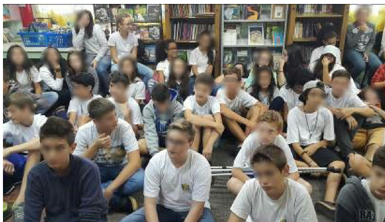
Fig. 8. Roda de conversas com a psicóloga. Elas e Eles.

Juntando-se a nós posteriormente os meninos (Fig. 8), a roda de conversas abordou de maneira natural assuntos como violência contra a mulher relacionando a Lei Federal Nº 11.340 (Lei Maria da Penha) e padrões estéticos estabelecidos entre outros conceitos que se tornassem necessário no momento. A Lei Maria da Penha já havia sido colocada em pauta atrelada a leitura de imagens de obras da artista Panmela Castro com o tema o grafite na defesa da mulher (Fig.9).