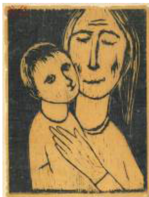
Fig. 2. Senhora com criança (1943) Lasar Segall