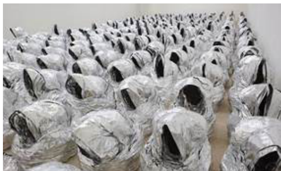
Fig. 3. Ghost (2007), Kader Attia