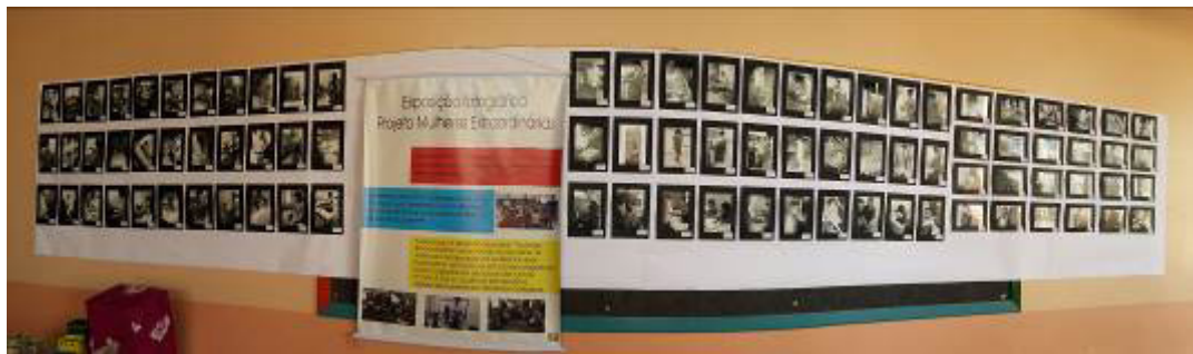
Fig. 5. “Exposição fotográfica- Mulheres Extraordinárias” exposta em outro local do ambiente escolar.

As fotografias após serem observadas foram reveladas em papel fotográfico, impressas em tamanhos 10x15cm, organizadas esteticamente sobre um suporte retangular branco dando origem a Exposição Fotográfica “Mulheres Extraordinárias” (Fig.5) exposta no ambiente escolar. Durante a exposição a comunidade pode apreciar as fotografias produzidas pelos(as) estudantes e ao apreciar os registros fotográficos a comunidade pôde identificar-se nos mesmos, refletindo e vivenciando o registro de suas próprias atividades cotidianas. Portanto, para os(as) estudantes a produção fotográfica ampliou e ressignificou seus olhares para aquelas personagens que fazem parte do seu dia a dia, citados nos depoimentos anteriormente.