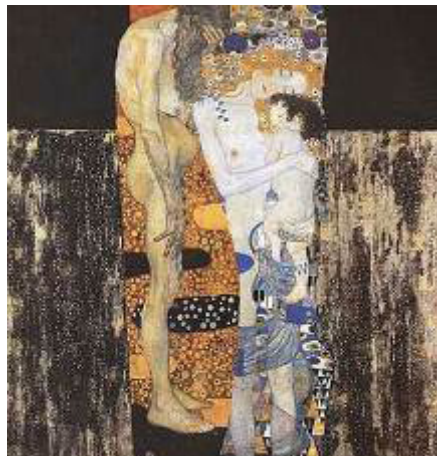
Fig. 1. Obra As três idades da Mulher (1905) de Gustav Klimt

Inicialmente a leitura de imagens de obras de arte com a temática de mulheres em diferentes contextos históricos nortearam os questionamentos. Entre as obras de arte apreciadas podemos destacar: As três idades da Mulher (1905), de Gustav Klimt (Fig. 1), Senhora com a criança (1943), de Lasar Segall (Fig. 2), e Ghost (2007), de Kader Attia (Fig. 3).