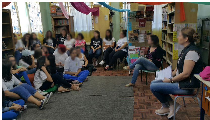
Fig. 7. Roda de conversas com a psicóloga. Ambiente preparado para elas.