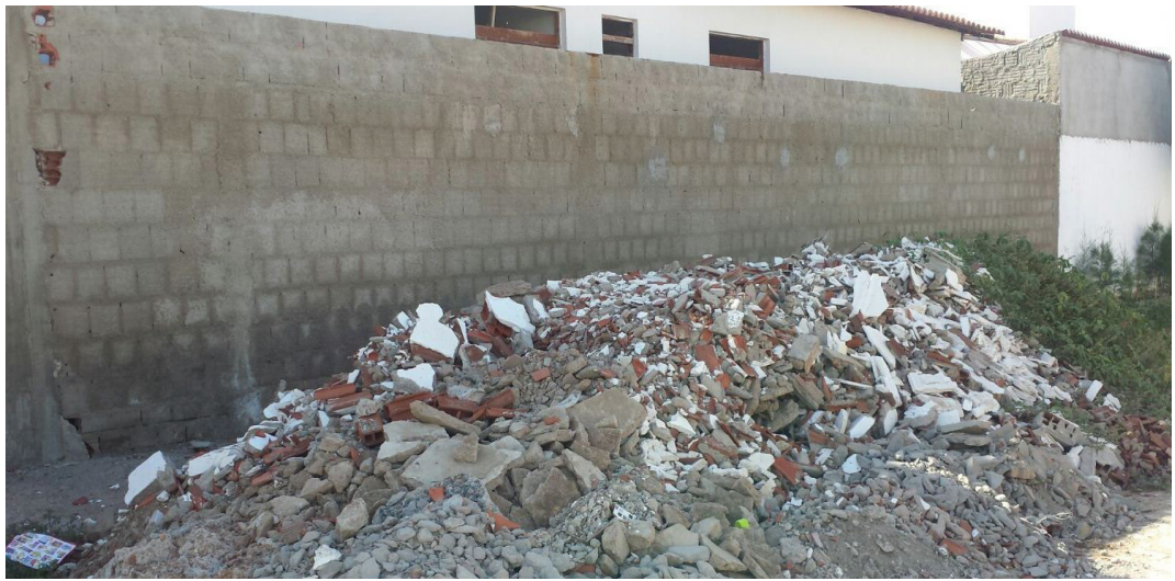
Figura 01. Entulhos dispostos de forma incorreta na cidade de Cajazeiras. IFPB, 2016.

também uma elevação na quantidade de resíduos, esses que muitas vezes são despejados de maneira inadequada em terrenos, encostas, lotes vagos, mostrando assim a necessidade de adequação da cidade às leis e normas para um direcionamento e regularização desse setor, como mostra as Figura 01 e Figura 02.