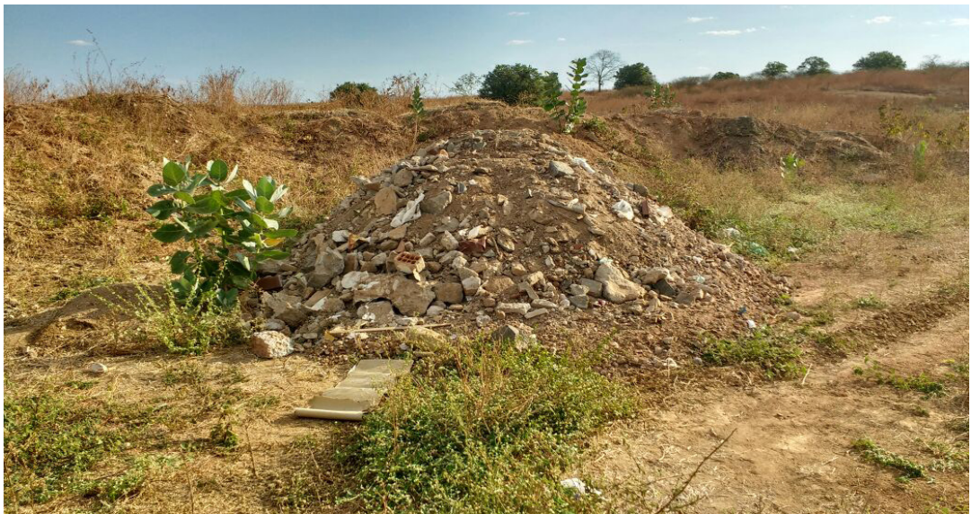
Figura 02. Entulhos dispostos de forma incorreta na cidade de Cajazeiras.

Diante da pesquisa realizada pode-se notar que a cidade de Cajazeiras ainda não se adequa a Política Nacional de Resíduos Sólidos (Lei Federal nº12.305/2010), que rege acerca da elaboração e implementação do PGRCC para as empresas de construção civil e a resolução CONAMA nº307/02 que estabelece diretrizes, critérios e procedimentos para a gestão dos resíduos da construção civil. Uma vez que as construtoras e a população ainda encontram a viabilidade da destinação final dos resíduos em terrenos e no lixão.