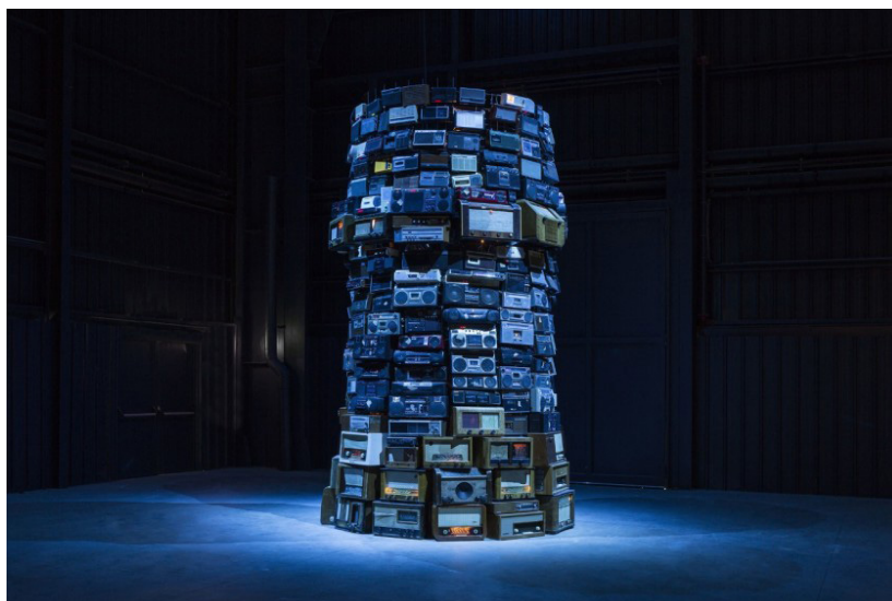
Fig. 1. Cildo Meireles, Babel , 2001. Disponível em: < https://www.tate.org.uk/art/images/work/T/T14/T14041_10.jpg >. Acesso em 19 maio 2019.

Focalizar em cultura e nela inserida a arte com todas as suas linguagens, é meter-se num complexo campo rastreado, coberto por camadas de sentidos. A obra Babel de Cildo Meireles (2001), que ocupa uma imensa sala na Tate Modern em Londres, é construída como uma torre de cinco metros de altura com rádios empilhados; cada um deles está sintonizado em uma estação diferente. A obra pode ser síntese e metáfora do emaranhado destas camadas de sentido.