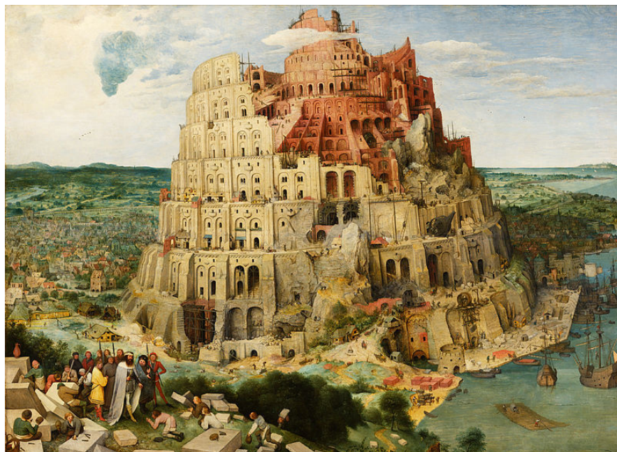
Fig. 2. Peter Bruegel, o Velho. Torre de Babel , 1563. Disponível em: < https://www.khm.at/objektdb/detail/323/?offset=37&lv=list >. Acesso em 19 maio 2019.

Cultura, arte e interdisciplinaridade são palavras-valise. Trazem dentro de si uma polifonia de sentidos. Ao analisar a Resolução nº 2, de 1º de julho de 2015 (que será chamada neste texto de DCN/FI), encontramos o termo “cultura” e delas derivados (culturais) citada 28 vezes. O termo “arte” ou “artístico” aparece duas vezes e relacionadas a ela – “estético(s)” ou “estética”, mais sete vezes. E “interdisciplinaridade” aparece 22 vezes. É por elas que analisamos o referido documento na busca de perceber sua potência e desafios.