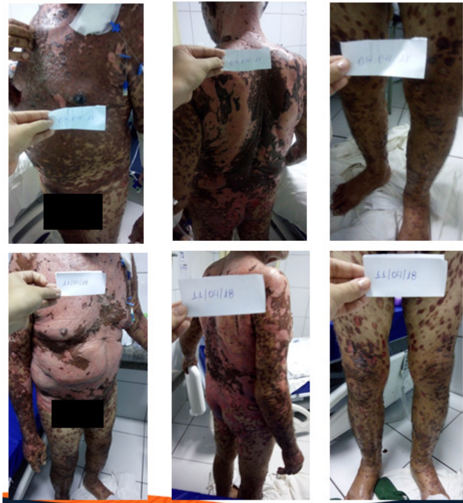
Figura 1: Paciente acometido pela síndrome de Stevens-Johnson antes de iniciar tratamento direcionado e após dois dias de início de tratamento.

A partir dia 05/04/2018 houve melhora das lesões com diminuição da dor aguda, perceptível hidratação da pele e cessação da febre. Houve reepitelização a partir da segunda semana de internação com possibilidade de alta no 26º dia.