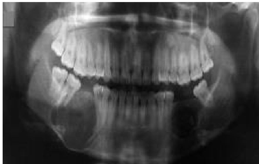
Figura 2: Achado radiográfico da lesão bilateral apresentando áreas radiolúcidas bem delimitadas