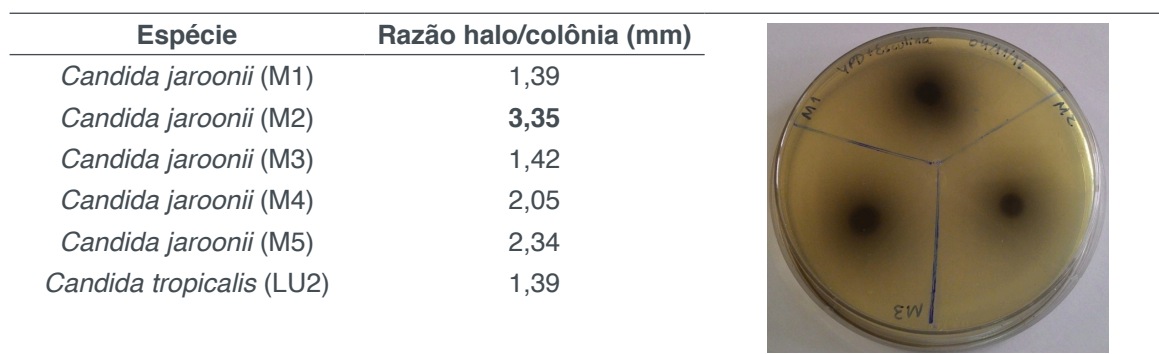
Tabela 2. Detecção de atividade de glicosidases em placa ágar-esculina. Em negrito destaca-

A atividade enzimática extracelular se apresentou positiva para todas as leveduras avaliadas, avaliadas em placa com meio ágar-esculina, com enfoque à isolada C. jaroonii (M2) que obteve o maior valor da razão halo/colônia, de 3,35 mm (Tabela 2).