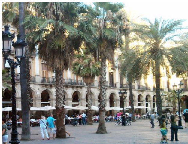
Figura 02 – Praça Real.

Segundo Zapatel (2011, p. 23) “os Planos Especiais de Reforma Interior são planos setoriais para a organização da forma física do território”. É realizado um estudo da problemática local e desenvolvido projetos específicos de pequeno porte com recursos públicos, como é o caso da Praça Real no bairro Gótico (Figura 02).