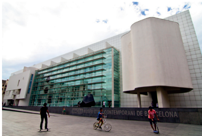
Figura 04 – MACBA

Richard Meier, autor do projeto, brincou com a cor branca, as claraboias de vidro e os materiais reluzentes para dar ao edifício uma sensação de grande luminosidade, porém, não utilizou em nenhum aspecto do edifício, algo que remetesse à cultura catalã (Figura 04). Enquanto as práticas arquitetônicas tidas como pós-modernas trataram de enxergar a individualidade das cidades, vincular-se à paisagem antrópica, recuperar valores culturais, comunicar-se mais diretamente com o cidadão, a ideia de arquitetura de Richard Meier se mostrou menos permeável à questão do contextualismo, físico ou cultural, pouco sensível à alusão figurativa, conservando em seu expediente as formas regulares, abstratas, marcadamente modernas, com baixa contaminação pelas circunstâncias e contingências locais.