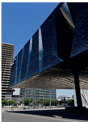
Figura 10 – Fachada - edifício BLAU