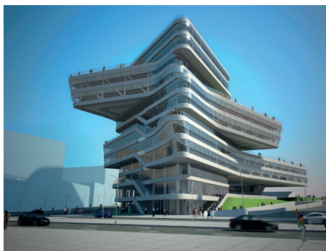
Figura 06 – A dinâmica na fachada da Torre Espiral.