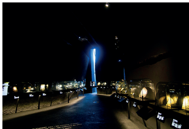
Figura 11 – Interior do museu