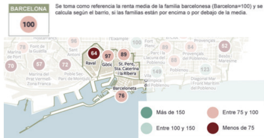
Figura 03 – Renda Média Familiar do distrito de Ciutat Vella .