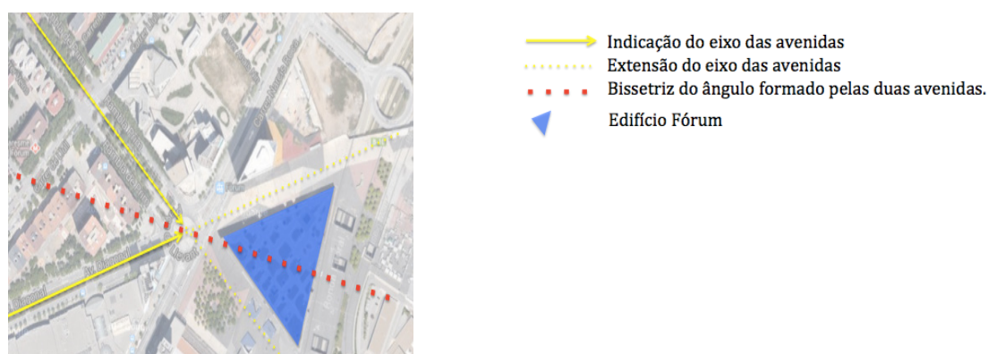
Figura 07 – Avenidas Diagonal e Prim e a bissetriz entre elas

Acatando a idéia de Acebillo, foi refeito o volume transformando o projeto em um triângulo. Porém, sua implantação tem um deslocamento com o alinhamento da Diagonal e Prim que muitos julgaram inadequado. Segundo Oriol Bohigas, este deslocamento na implantação “é um erro fundamental” e continua dizendo “Tudo bem que Acebillo forçou-os a usar a forma triangular, pois ali é a lógica. Mas é errado que permitissem colocar o Edifício com uma leve torção sobre seu eixo, de modo que não permite a extensão da Diagonal e Prim formando as fachadas (Figura 07). Em vez disso, esplanadas manchadas com pequenos mobiliários urbanos. Insisto: um erro” (MOIX, 2010, p. 143).