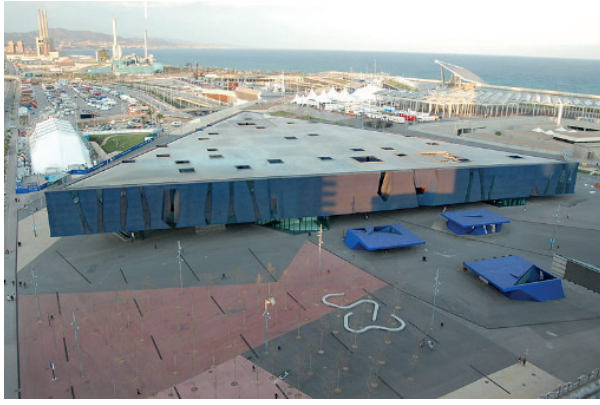
Figura 08 - Edifício Fórum e as clarabóias.