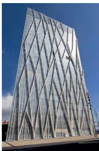
Figura 05 – Torre da Telefônica.

Um dos ícones que conseguiu “sair do papel” foi a Torre da Telefônica (Figura 05). Porém, a paisagem ao redor não é tão instigante quanto esta torre de alta tecnologia. Segundo o jornalista Benvenuty (2011, online ), os esqueletos de concreto abandonados ao redor da Torre ilustram a dificuldade que será no futuro conseguir inaugurar outros edifícios deste porte: “Passará muito tempo antes que Barcelona viva um dia igual”. Esta afirmação se concretizou, pois vários edifícios não saíram do papel, como é o caso do edifício para o campus Diagonal-Besòs da Universidade Politécnica da Catalunha (UPC), projetado pela arquiteta Zaha Hadid (Figura 06). Segundo a sala de imprensa da Faculdade Politécnica da Catalunha, a Torre Espiral queria ser um nóculo de conexão, um edifício que integrasse o tecido das duas zonas urbanas fronteiriças enfatizando suas potencialidades. E prossegue dizendo que seria a porta arquitetônica que ligaria urbanisticamente a área do Fórum, o Campus e o Distrito 22@ (SALA DE PRENSA UPC, 2009, online ). Em 2008 o projeto foi aprovado e em 2009 iniciou-se as obras, juntamente com o início dos rumores da crise econômica que forçou a paralização do empreendimento.