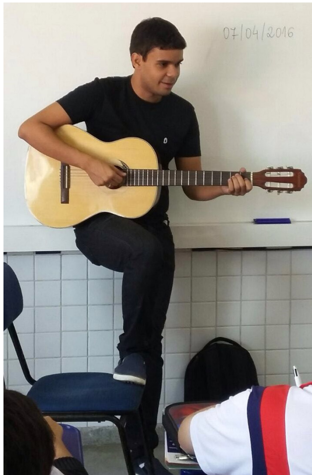
Figura 2: Momento de execução da composição.

A utilização deste recurso obteve como resultado prévio a depreensão dos conceitos fulcrais da bioquímica enfatizados através da letra da música e alicerçados pela ludicidade encantadora da ferramenta educacional. Momentos posteriores constataram que os estudantes haviam aprendido a letra e o ritmo da música e inclusive, eram capazes de reproduzi-la fielmente a como fora elaborada, elucidando a veracidade quanto da compreensão dos conteúdos que se encontram impressos na obra uma vez que toda vez que esta seja recordada trará consigo tais saberes.