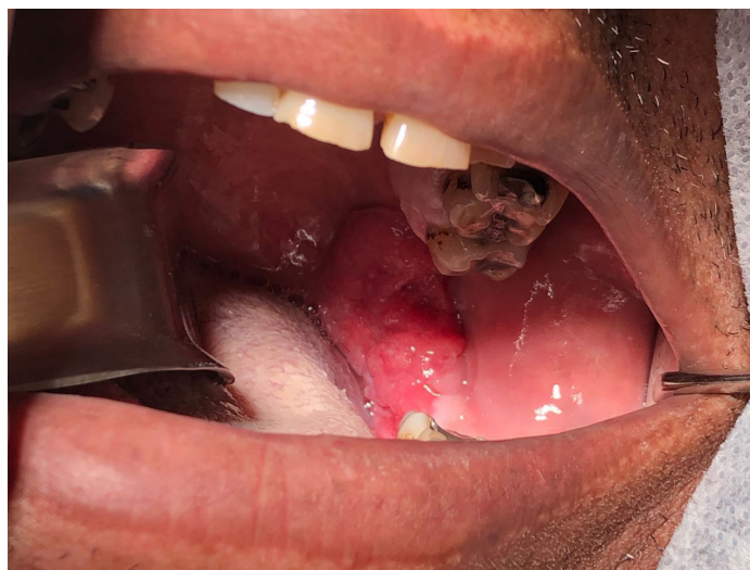
Figura 1. Lesão ulcerovegetante no bordo ascendente direito da mandíbula

Os exames sanguíneos dos pacientes estavam normais com exceção a Proteína C reativa que se apresentou com valor de 13 mg/dL. Frente ao diagnóstico clínico, foi realizada a biópsia de um fragmento da lesão (Figura 2) e enviada para análise histopatológica. Após a biópsia foi prescrito dipirona sódica de 500 mg duas vezes ao dia para o controle de dor durante uma semana. O diagnóstico diferencial da lesão foi carcinoma espinocelular e paracoccidiodomicose. O resultado da biópsia da lesão confirmou o diagnóstico de carcinoma de células escamosas diferenciadamente moderadamente invasivo. O paciente foi encaminhado para o Hospital do Amor I Fundação Pio XII, Barretos, São Paulo para o tratamento oncológico. Ressalta-se que o centro de triagem do Curso de Odontologia do UNIFEB tem feito mensalmente tentativas de contato com o paciente por meio de cartas e telefonemas a fim de poder conhecer o desfecho do tratamento, entretanto, já se passaram 12 meses e não tivemos sucessos na localização do mesmo.