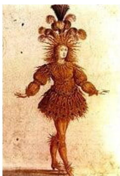
Figura 1- Luís XIV como o Rei Sol

Nada mais eminente e claro do que os meios de persuasão fazendo com que a todo momento a imagem do rei fosse louvada dos mais variados modos, conferindo-lhe um poder absoluto, tornando digno o codinome que Luís XIV recebeu: o de o Rei Sol.