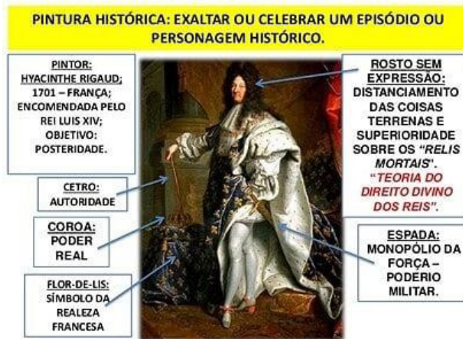
Figura 2- Análise do “Retrato de Luís XIV”