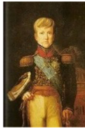
Figura 4- D. Pedro aos 12 anos

de D. Amélia, segunda esposa de D. Pedro I, que entre lágrimas pedia “as mães brasileiras que cuidassem de seu pequeno, assim como zelavam por seus próprios filhos”. O Príncipe então passou a ser reconhecido como o “pupilo da nação”. Com a partida de D. Pedro I para Portugal, passou-se a focar na figura do herdeiro ao trono brasileiro. O jovem passou a ser aclamado nos jornais como sendo o consolidador da independência do Brasil, aquele que iria se voltar para os interesses da pátria. As imagens divulgadas de Pedro de Alcântara eram sempre as oficiais, representando um menino que não se separava da nação. Que era rei a todo momento, com um cenário montado em tempo integral num teatro previsível (SCHWARCZ, 1998).