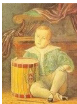
Figura 3- O menino D. Pedro no Paço

D. Pedro II, e ao observá-las percebe-se não apenas o crescimento cronológico do personagem, mas momentos diversos de sua construção como o símbolo do Estado. Partindo da observação de algumas das imagens do imperador, Schwarcz (1998) percebe que há poucas imagens retratando D. Pedro II em sua infância, e a mais conhecida mostra o futuro imperador sentado ao lado de um vistoso tambor. No entanto, a cena oficial já se impõe a representação familiar e pessoal, uma vez que na imagem podem ser observados os emblemas da monarquia, que se encontra em toda a parte: no tambor, no jaleco do menino, mesmo a cor verde do paletó do imperador indica a marca heráldica de seus pais.