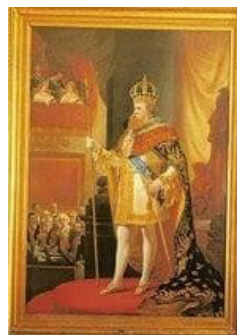
Figura 5- D. Pedro: Abertura da Assembleia Geral

Para a construção da imagem pública de D. Pedro II também ocorreu a tropicalização do monarca. Este era caracterizado com ramos de café e tabaco ao seu redor, em sua roupa, etc. O imperador era cercado de alegorias. Às vezes era coroado como um César em meio a coqueiros e com um livro na mão. Tudo isso feito com o intuito de tornar o imperador um símbolo de nacionalidade.