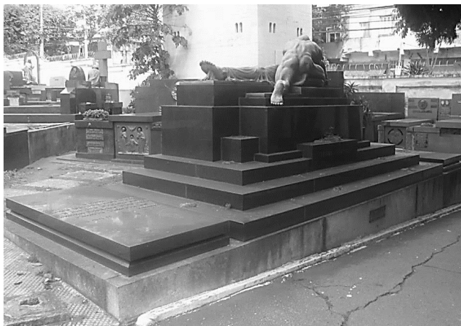
FIGURA 1 – O último adeus (c. 1945), escultura em bronze de Alfredo Oliani, Cemitério São Paulo. FONTE: acervo da autora, 2014.

A narratividade do amor é o elemento central da composição O último adeus (c. 1945), do escultor Alfredo Oliani (1906-1988), concebida para o túmulo da Família Cantarella, no Cemitério São Paulo (FIGURA 1).