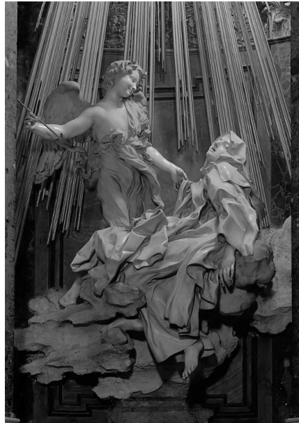
FIGURA 5 – Detalhes de Êxtase de Santa Teresa (1647-1652), de Gian Bernini, Basílica de Santa Maria da Vitória.

Deste modo, é o desejo de continuidade visto na morte que fascina e a torna erótica, violadora. Em Êxtase de Santa Teresa (1647-1652) (FIGURA 5), Bernini representa a experiência mística de Santa Teresa de Ávila (1515-1582), quando esta é trespassada por uma seta de amor divino.