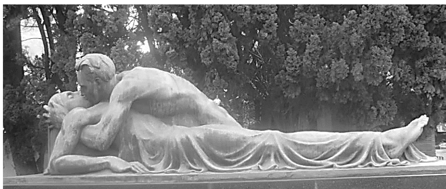
FIGURA 2 – Detalhe de O último adeus.

Aos corpos o artista imprimiu contornos de sensualidade (FIGURA 2).