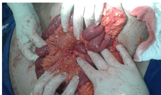
Figura 2 - Múltiplos implantes peritoneais, em todo mesentério, mesocólon e epiplon (carcinomatose).