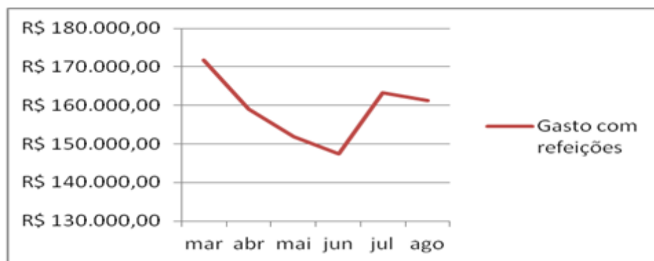
Figura 2 – Gastos com refeições no HRDM, de março a agosto de 2016.