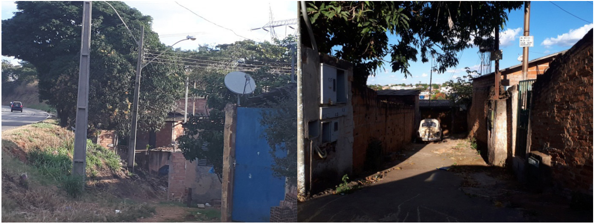
Figura 3: Aglomerado subnormal Setor Universitário