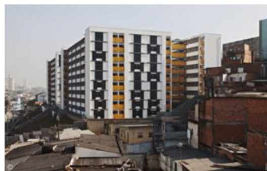
Figura 5 – Conjunto Habitacional Corruíras