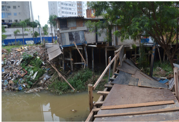
Figura 2 – Favela do Sapo, após reocupação em 2017