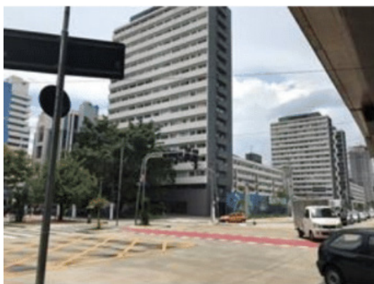
Figura 4 – Conjunto Habitacional Jardim Edite

Devido às constantes mobilizações e protestos realizados pela população, em 2016, o então prefeito Fernando Haddad suspendeu as obras do túnel, enquanto as obras do parque linear foram mantidas. Em relação ao atendimento habitacional à população de baixa renda afetada pelas obras da operação, muito pouco foi feito até o momento. Após 17 anos da aprovação da OUCAE, das 8.424 famílias cadastradas para receberem atendimento definitivo, apenas 1.032 receberam sua unidade habitacional. Dentre os conjuntos entregues, dois deles – Jardim Edite (Figura 4) e Corruíras (Figura 5) – ficaram bastante conhecidos no cenário nacional, por tornarem-se referências no que diz respeito à habitação social com arquitetura e inserção urbana qualificadas.