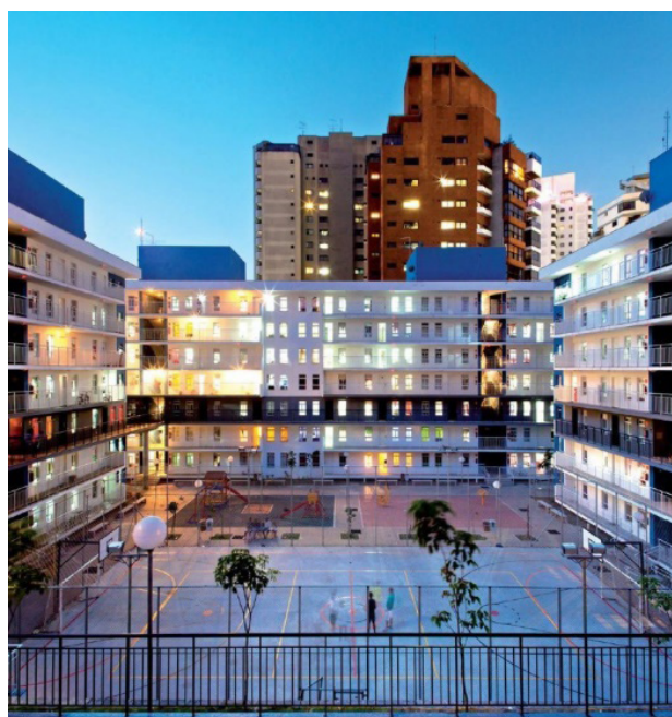
Figura 3 – Parte do Conjunto Habitacional Real Parque

Em 2008, a prefeitura do município iniciou o processo de cadastramento dos moradores desses três assentamentos, com o propósito de dimensionar o déficit habitacional da área, chegando ao número de 2.437 famílias com necessidade de atendimento. De acordo com dados oficiais disponibilizados pelo poder público, até o momento foram construídas 1.246 unidades habitacionais, destinadas a atender famílias provenientes da favela Real Parque. Nesse projeto, mostrado na Figura 3, foram gastos aproximadamente R$ 298 milhões com as obras e R$ 8 milhões com desapropriações.