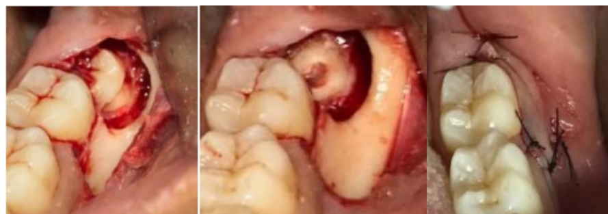
Imagem 2, 3 e 4 – Procedimento de Coronectomia