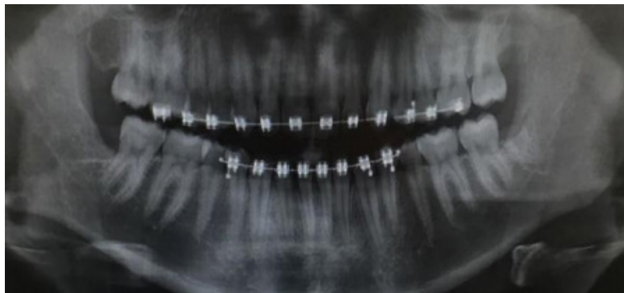
Imagem 6 – Radiografia Panorâmica, após 02 meses do procedimento