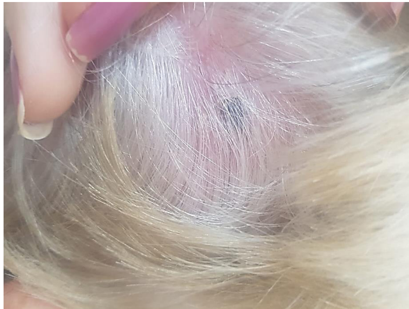
Foto 1 - Lesão Ulcerada Crostosa Em Couro Cabeludo A Esquerda

Paciente persistiu com otalgia importante, sendo prescrito pregabalina, gabapentina e carbamazepina para o controle da dor. Segue em acompanhamento com neurologista para o controle da dor neuropática, sem outros sintomas. Não houve paralisia facial em nenhum momento.