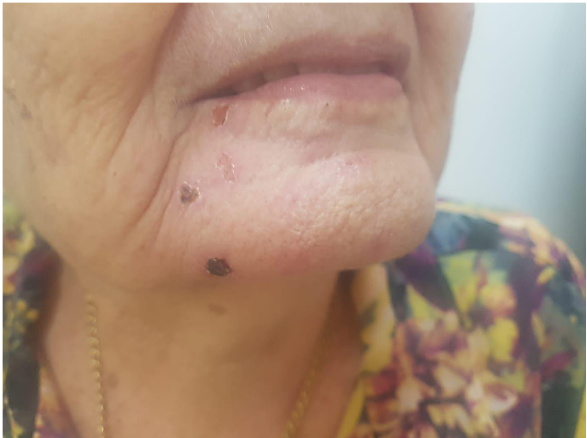
Foto 2 - Lesões Vesiculares Com Aspecto De Crosta Em Região Oral