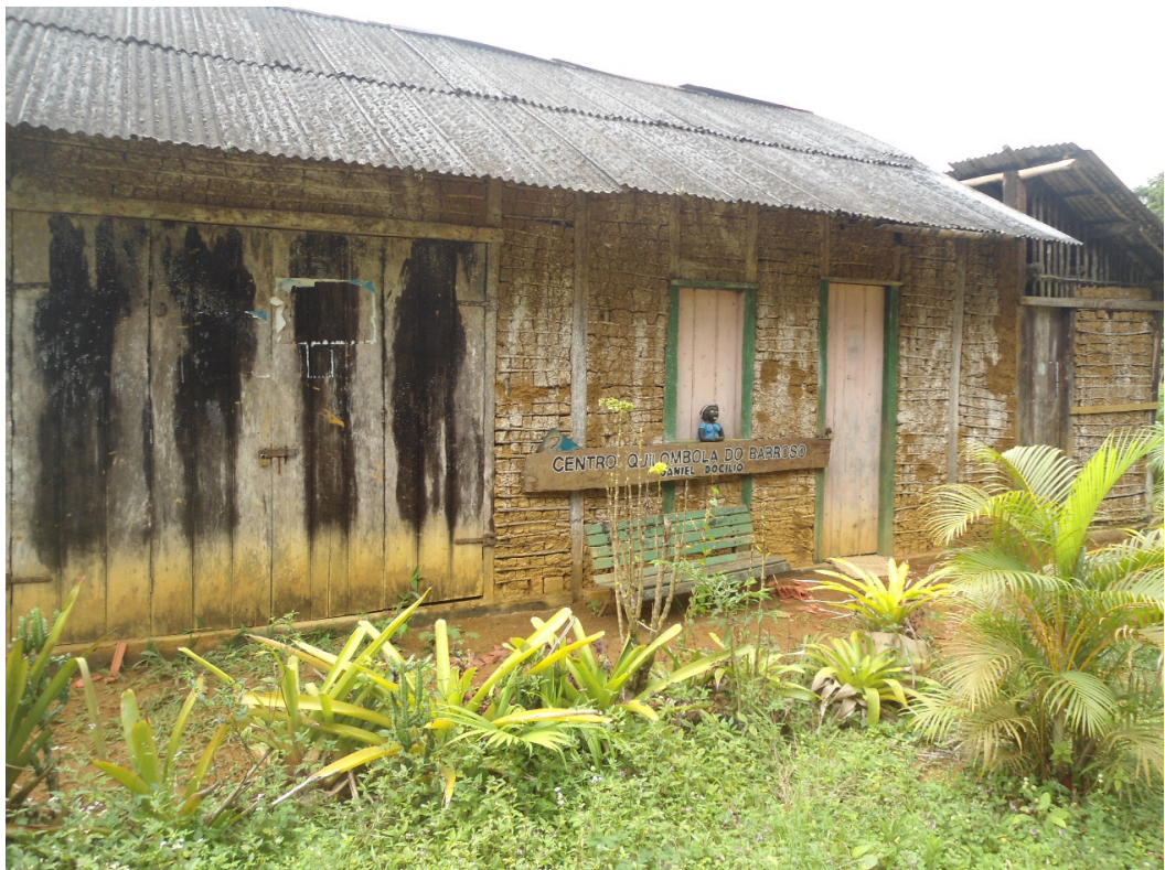
Imagem 1: Área externa do museu

Ao visitar a comunidade, numa tarde ensolarada de janeiro tivemos a oportunidade de conhecer o Centro Quilombola do Barroso Daniel Docílio (imagem 1), o lugar que atrai olhares de todos os visitantes por resguardar a história local através de objetos, fotografias, vestuários e moedas de pessoas que pertenceram ao lugar no passado e também no presente, como afirma a líder: “Eu também quero fazer aqui acervo a história das pessoas importante da Comunidade todas são importante, né, mas tem gente que deixa marcas”, em sua narrativa “tudo parece merecer fé, uma mesma luz parece iluminar todas as paredes” (HALBWACHS, 1990, p.77).