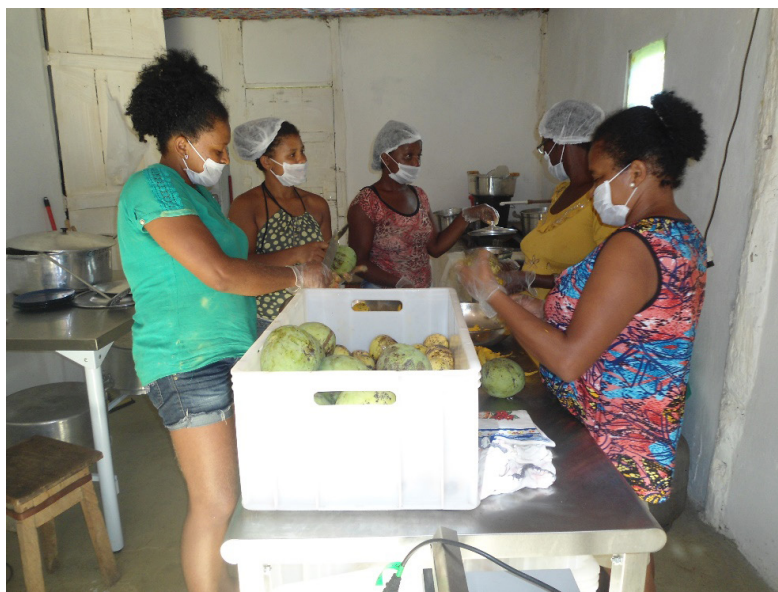
Imagem 4: Produção de Polpas

No Brasil, a auto-atribuição de identidades étnicas tem se tornado uma questão importante os últimos anos, por meio da organização política de grupos que reivindicam o reconhecimento dos territórios que ocupam, como no caso dos povos indígenas e das chamadas comunidades remanescentes de quilombos (O'DWYER, 2007).