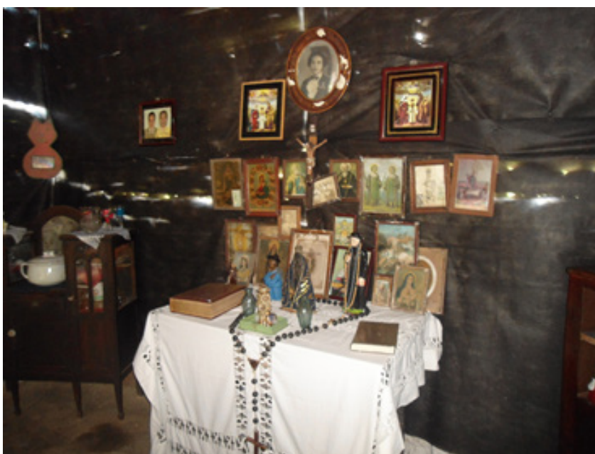
Imagem 3: Altar de santo do museu