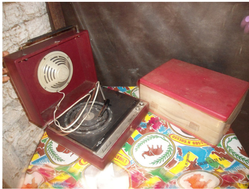
Imagem 2: Radiolas do museu