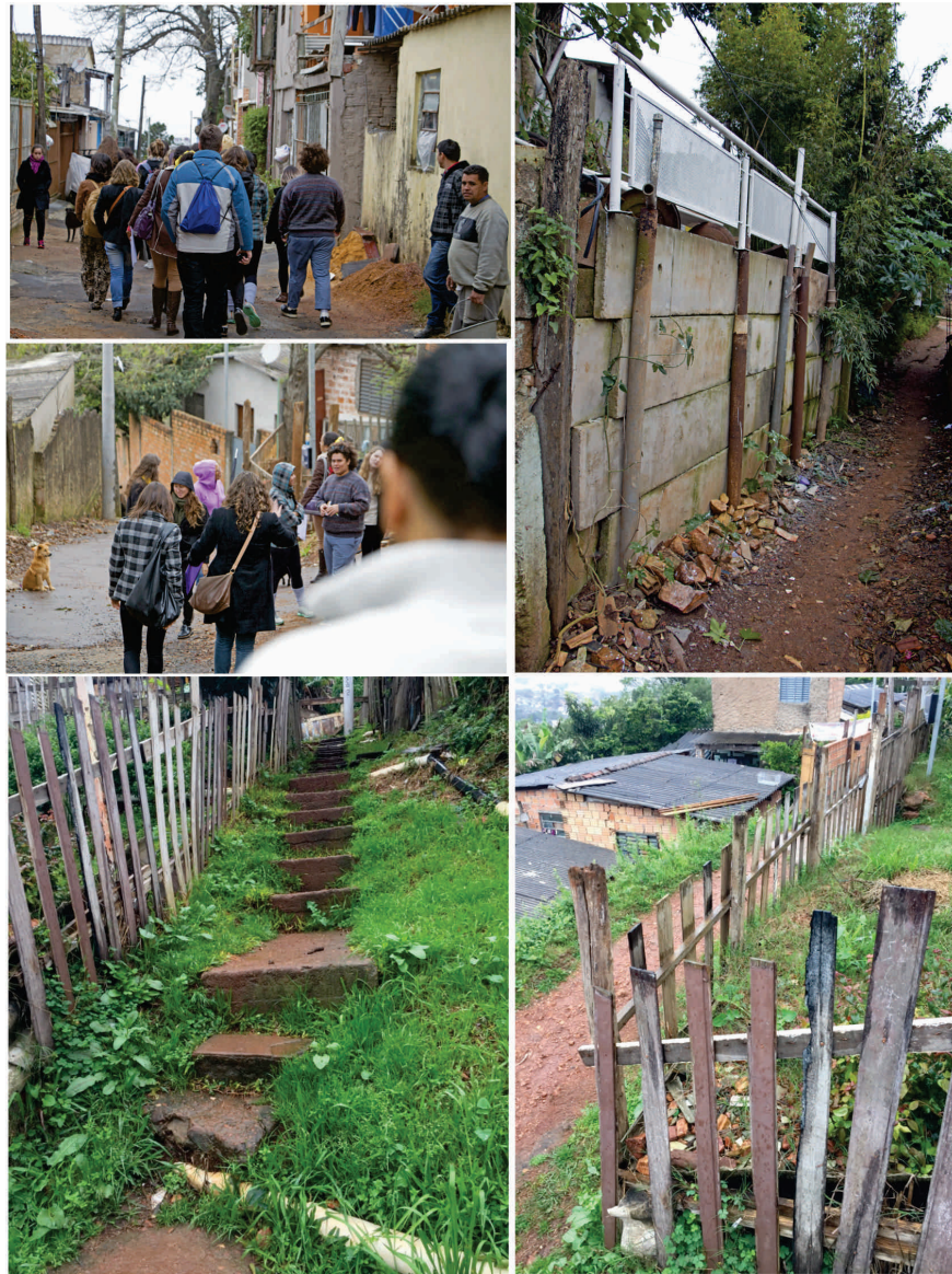
Figura 3: Vila União Santa Teresa: visita dos alunos na área de estudo

A Vila União possui 149 domicílios 5 em um território de aproximadamente 2,4 hectares caracterizado por declividade alta, vias estreitas e descontínuas. Com relação à infraestrutura, não há rede de esgotamento sanitário e nem sistema de drenagem. Segundo relato da líder comunitária, muitas das melhorias ocorridas na vila são obras realizadas pela própria comunidade, como valas para drenagem, bocas de lobo e algumas escadarias. As redes de abastecimento de água e de energia elétrica, demandas antigas da comunidade, foram instaladas em 2015. A Vila não possui equipamentos públicos no seu território e a comunidade utiliza o “campinho”, uma área vazia no alto do morro, para a realização das atividades comunitárias, como a festa de “Inauguração da Luz” que comemorou a iluminação pública no morro e as festas de “Dia das Crianças” e “Ano Novo”. As situações de risco, decorrentes da existência de corpos hídricos associados à declividade e à ocupação nas margens dos arroios, são algumas das fragilidades cotidianas conhecidas pela comunidade.