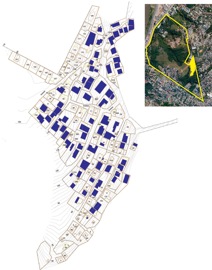
Figura2: Topografia da Vila União Santa Teresa –