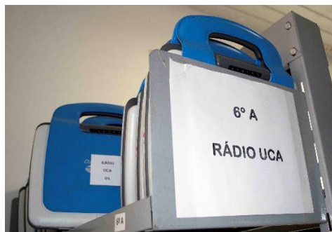
Figura 1 Laptops utilizados no projeto da Rádio EdUCA.

Complementado esta introdução, consideramos pertinente apresentar nossa trajetória acadêmica, evidenciando os fatores que nos motivaram a conduzir esta investigação.