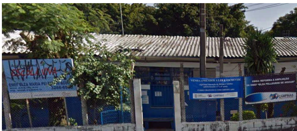
Figura 2 Aspecto geral da fachada da EMEF Profa. Elza Maria Pellegrini de Aguiar

Além da participação eventual de outros educadores em algumas sessões de trabalho, convém registrar a presença assídua de uma educadora ligada ao Programa Mais Educação.