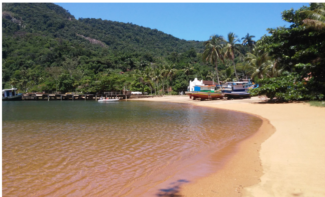
Praia da Longa – Ilha Grande/RJ