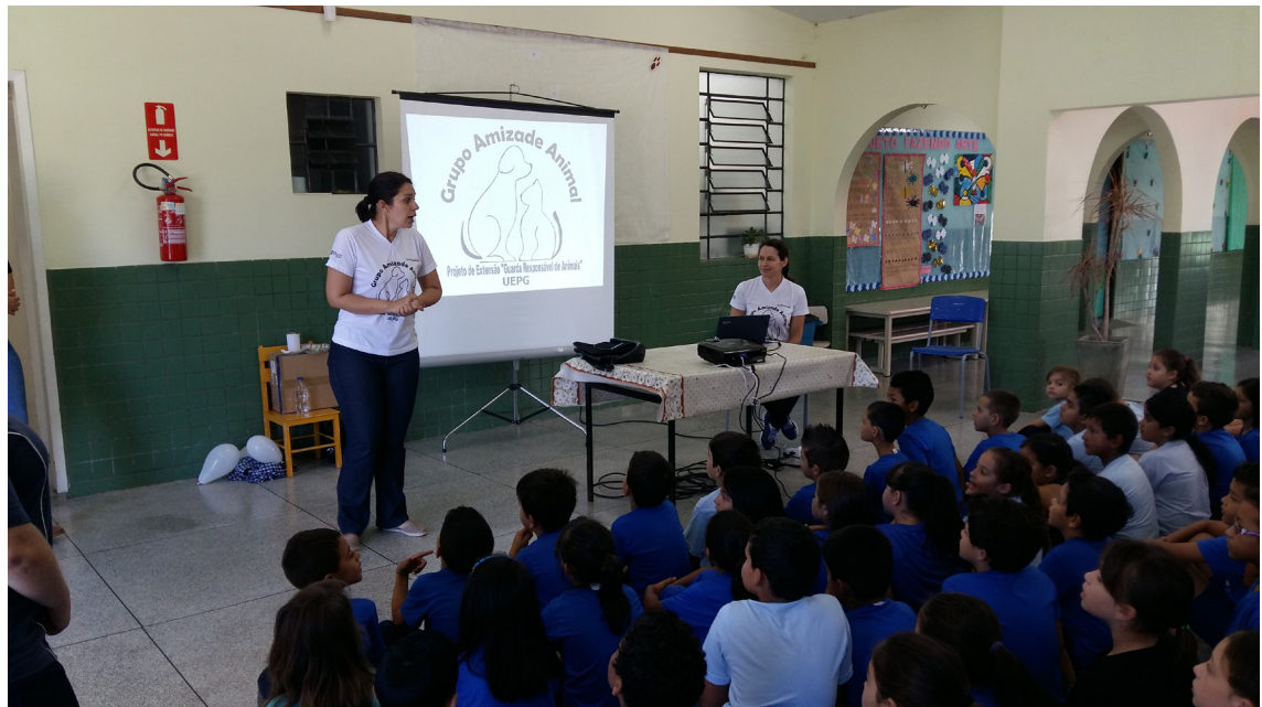
Figura 1: Foto da apresentação da palestra para crianças

O público-alvo primordial era composto pelas crianças, mas o projeto atingiu adolescentes e adultos de todas as idades (estima-se um total de 1.000 pessoas), pois houve uma grande divulgação do projeto na festa junina realizada nas dependências do CAIC no ano de 2016, onde tivemos à disposição uma barraca para exposição de nosso material informativo (Figura 2), além de atividades recreativas relacionadas ao tema para entreter as crianças e os pais.