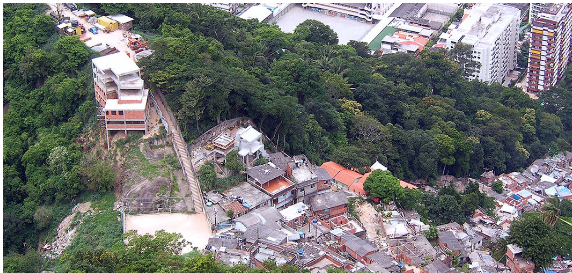
Figura 2 - A creche em construção no topo do Morro Santa Marta

serviu como um sinal de alerta sobre a proximidade física entre a favela e o bairro que partilham encostas distintas do mesmo morro, embora o caminho conectando ambos fosse utilizado pelos moradores do Santa Marta, por décadas sem despertar qualquer incômodo. Enquanto não viam os sinais da favela, os moradores de Laranjeiras desconheciam, e não se preocupavam, com esta proximidade ou com a ligação entre eles.