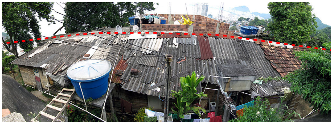
Figura 6 – Os Eco-limites são perceptíveis através da qualidade e materiais das construções

Essa demarcação traça um novo perfil de ocupação nestas áreas: na verdade as fronteiras permanecem sendo constantemente testadas, as construções existentes além do perímetro permanecem ocupadas, e mesmo novas eventualmente acontecem, mas essas moradias convivem com a ameaça permanente de remoção e a conseqüente perda, não apenas da casa, mas também do investimento realizado na melhoria da construção. Esta situação não impede, mas congela as moradias deste setor, restringindo a progressão da construção ao limiar de sua funcionalidade (Figura 6). Se por um lado existe a “aceitação” daqueles que se encontram dentro dos limites traçados, por outro lado percebe-se a busca do apagamento daqueles que estão fora.