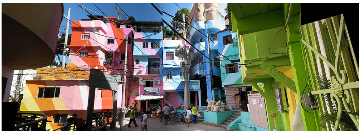
Figura 3 - A Praça do Cantão, após intervenção de pintura

com a cidade formal, criando um simulacro de espaço “ordenado”, que encobriria a incapacidade de lidar com o problema de uma inclusão ampla e universal no espaço urbano.