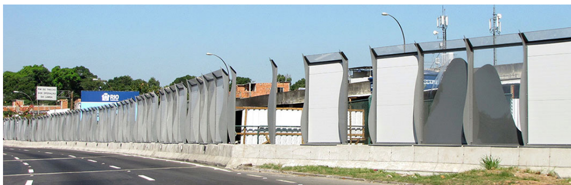
Figura 1 - A “Barreira Acústica” sendo instalada na Linha Vermelha

Apesar da repercussão dos projetos, a importância da Linha Vermelha como um dos principais acessos rodoviários da cidade, sua conexão com o aeroporto internacional e alguns episódios violentos pontuais, parecem ter falado mais alto e a prefeitura da cidade instalou, em 2010, uma barreira de três metros de altura ao longo de toda área de contato entre a via e a Favela da Maré. Provavelmente com objetivo de minimizar as reações contrárias, o discurso foi atualizado e os painéis coloridos e translúcidos, instalados sobre uma mureta de concreto, se tornaram uma “barreira acústica” para proteção e conforto das moradias próximas às vias rápidas (Figura 1).