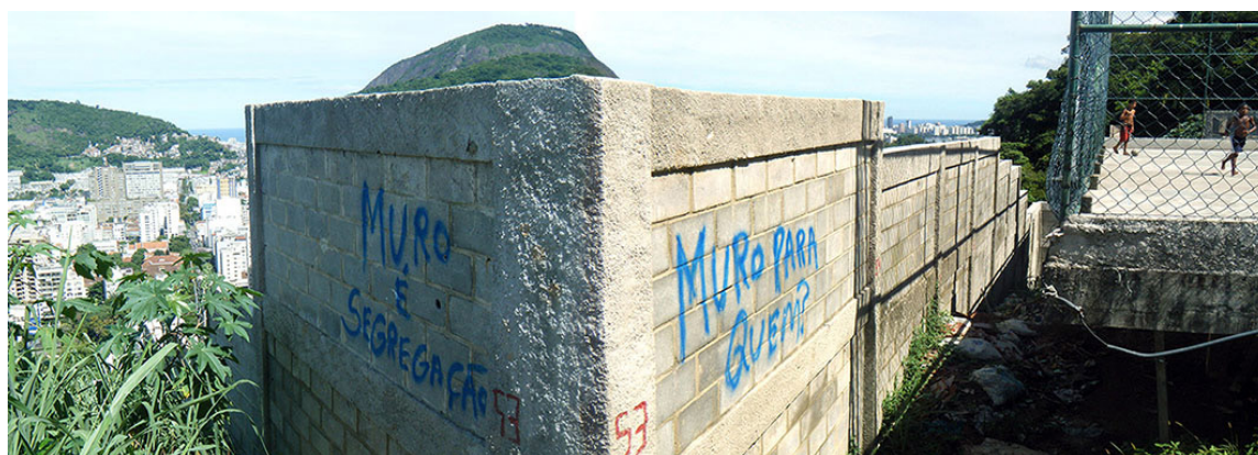
Figura 4 – Manifestações impressas no muro do Santa Marta

A escolha do Santa Marta expõe a fragilidade do discurso oficial de proteção das matas nas encostas, visto que desde as décadas de 1960-70 a favela tem registrado redução da área total ocupada, com um conseqüente adensamento e elevação da quantidade de pavimentos em seu interior. Os limites da ocupação se estruturavam, por um lado, através de uma longa calha de escoamento de águas pluviais, que, apesar de ser uma barreira facilmente transponível, demarcava um limite simbólico claro inibindo a expansão. E, por outro lado, um terreno privado e, posteriormente, a instalação do plano inclinado se constituíram como limites suficientemente fortes para serem respeitados ao longo deste período (LOBOSCO, 2013).