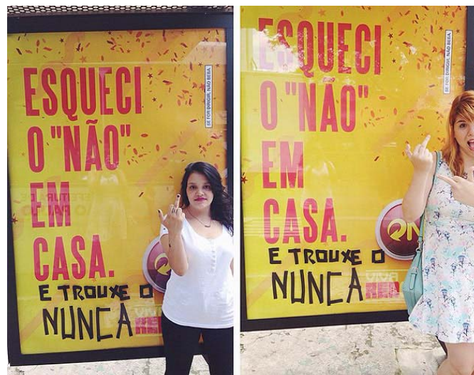
Figura 2: A polêmica da cerveja Skol

Em 2015, a marca de cerveja Skol lançou uma campanha de Carnaval que foi espalhada por todo os País através de outdoors, com frase do tipo “topo antes de saber a pergunta” e “esqueci o não em casa”. A campanha ganhou forte repercussão após a intervenção da publicitaria Pri Ferrari e da Jornalista Mila Alves, que modificaram uma das frases para “esqueci o não em casa e trouxe o nunca”, em repudio a campanha (Figura 2).