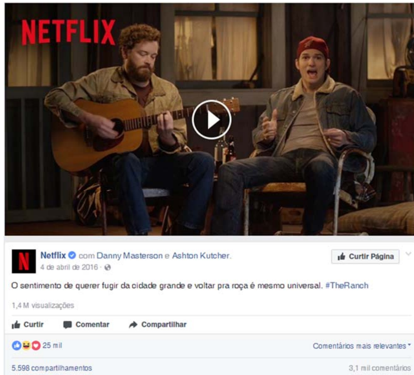
Figura 7 – The Ranch