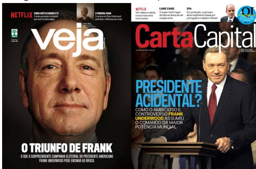
Figura 6 – A série House Of Cards nas capas de revistas nacionais

na publicidade (figura 4) no Brasil e no Mundo. No Brasil, segue com essa estratégia no relacionamento com seu público-alvo e assinantes. Para promover a quarta temporada de House Of Cards em 2016, o personagem de Kevin Space, Frank Underwood apareceu em várias capas de revista conhecidas nacionalmente, tais como, a Veja e Carta Capital e jornais como cearense ‘O Povo’ e o gaúcho ‘Zero Hora’ em um contexto de clara estratégia de comunicação digital a partir de uma leitura do momento político que o Brasil atravessava (Figura 6).