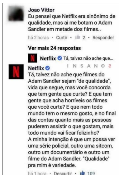
Figura 9: Sobre os filmes de Adam Sandler