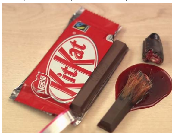
Figura 3: A polêmica campanha do Greenpeace no YouTube

Em março de 2010, a Organização Não Governamental Greenpeace publicou um vídeo no site Youtube parodiando um anúncio do chocolate Kit Kat da Nestlé. Nele o consumidor mastiga, sem perceber, o dedo de um orangotango (Figura 3). Ao final do vídeo há uma mensagem direcionada aos consumidores: “Impeça a Nestlé de comprar Óleo de Palma de fornecedores que destroem as florestas tropicais” (Figura 4). Tratava-se de um manifesto contra a política de compras da multinacional suíça. A repercussão e disseminação do vídeo foi grande e a Nestlé solicitou aos administradores do Youtube a sua retirada do site. A tentativa de suprimir o vídeo acabou gerando ainda mais interesse do público. Diversas críticas à Nestlé começaram a ser publicadas e discutidas no site de relacionamentos Facebook. A Nestlé reagiu apagando os comentários com críticas dos consumidores.