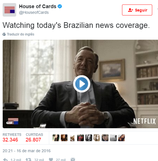
Figura 8 – House of cards

Com um serviço personalizado, é uma marca que conhece os gostos de seus clientes. A empresa conhece e entende seu público e mostra isso, fala a língua dos usuários assim que ele consegue interagir e criar um relacionamento com seus clientes. São rápidos para atender e responder os questionamentos de todas as mídias sociais, sempre com muito humor e simpatia (Figuras 9 e 10).