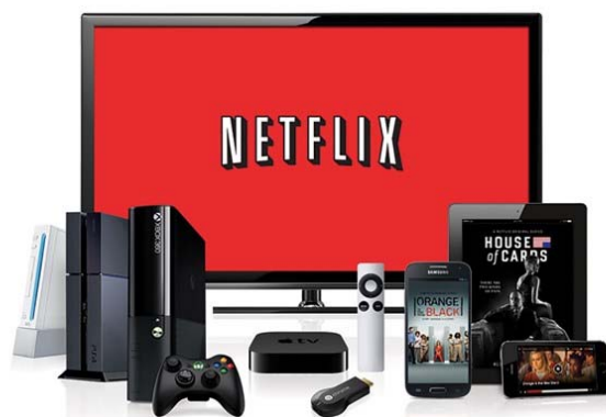
Figura 5: Dispositivos que reproduzem a Netflix