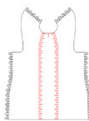
post-couture dress digital design file € 5