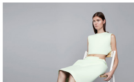
post-couture skirt | digital design file € 5