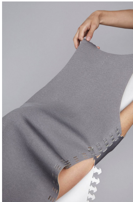
Figura3: Montagem ao invés de costura