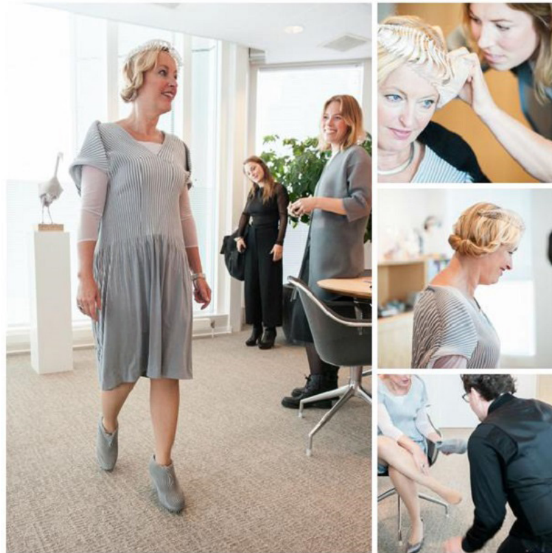
Figura 1: Jet Bussemaker se preparando para a cerimônia do dia do rei na Holanda