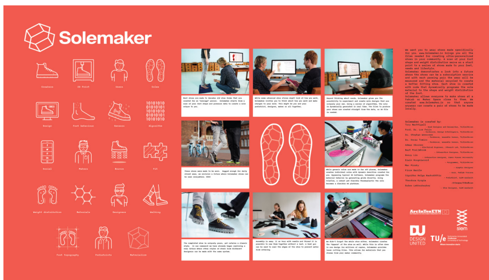
Figura 5: Projeto “Solemaker”

maneira, a sola do sapato pode se tornar mais ou menos flexível em determinadas regiões, assim como com maior ou menor densidade para suportar regiões de pesos específicos. O design da sola do tênis seria baixada pela internet (“downloadable design”) e impressa na impressora 3D utilizando filamento flexível. O projeto está em andamento e foi apresentado na exposição “Mind the Step” durante o evento “Dutch Design Week” 2016. Este projeto pode ser combinado com um outro projeto já comercializado do mesmo autor, intitulado “One Day Shoe”. No website, pode-se escolher a numeração e comprar o kit que vem com as solas de um sneaker, um pedaço de couro, alguns materiais e ferramentas para fazer sapatos. No mesmo momento baixa-se a modelagem opensource do sneaker que o próprio cliente pode cortar e fazer estampas com engravas em uma máquina de corte à laser. Depois de cortado, o cliente monta seu próprio calçado.