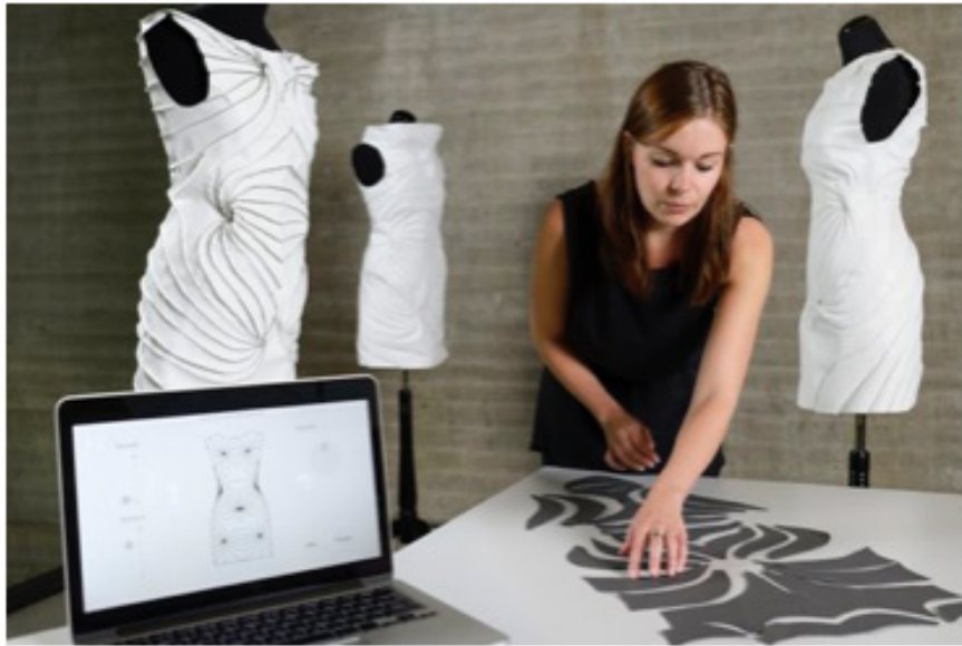
Figura 2: Coleção “This Fits Me” de Leonie Tenthof