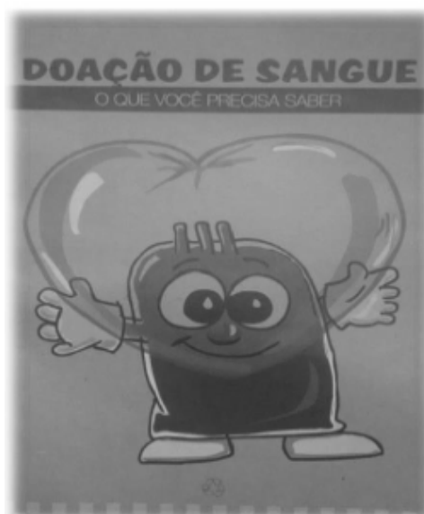
Figura 1: Cartilha explicativa do hemocentro, versão 01.

Foi fornecido o material de apoio utilizado para a conscientização da população. Este material serviu de apoio para o desenvolvimento do software. As figuras 1 mostra a versão 01 da cartilha explicativa que é distribuída pelo hemocentro, publicada em outubro de 2014. A figura 2 apresenta a cartilha com os requisitos necessários para a realização da doação de sangue.