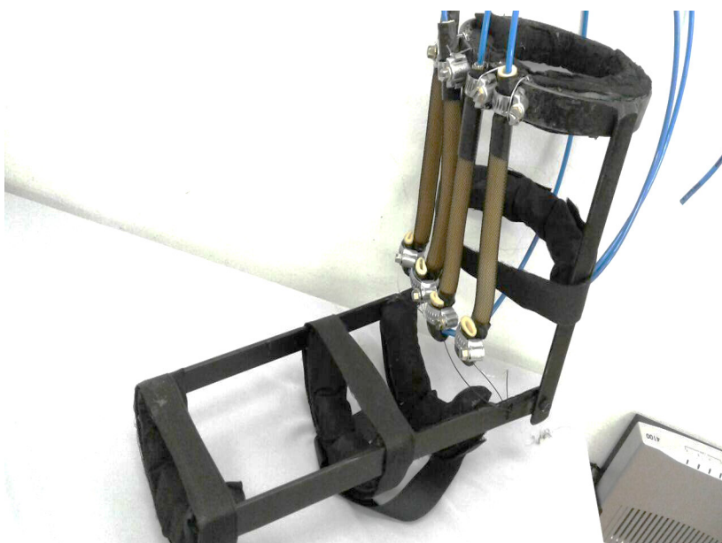
Figure 2. Prototype of upper limb exoskeleton through pneumatic muscles.

An initial prototype with iron structure was developed (Fig. 2). The device allowed extension and flexion control from the EMG signal of the brachial biceps.