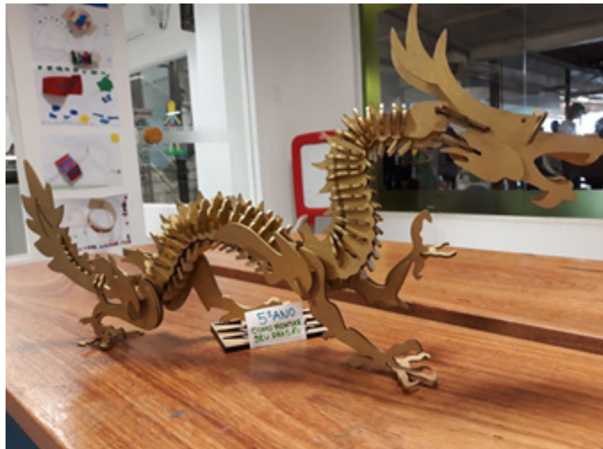
Figura 2. Protótipo confeccionado em 3 dimensões.

Essa atividade permite que os alunos entendam o conceito das três dimensões, desenvolvam atenção, raciocínio lógico, atuem com a memória, motivando a habilidade de observar, comparar e se comunicar em grupo para garantir a eficiência dos seus resultados, desenvolvendo suas inteligências e estimulando a aprendizagem.