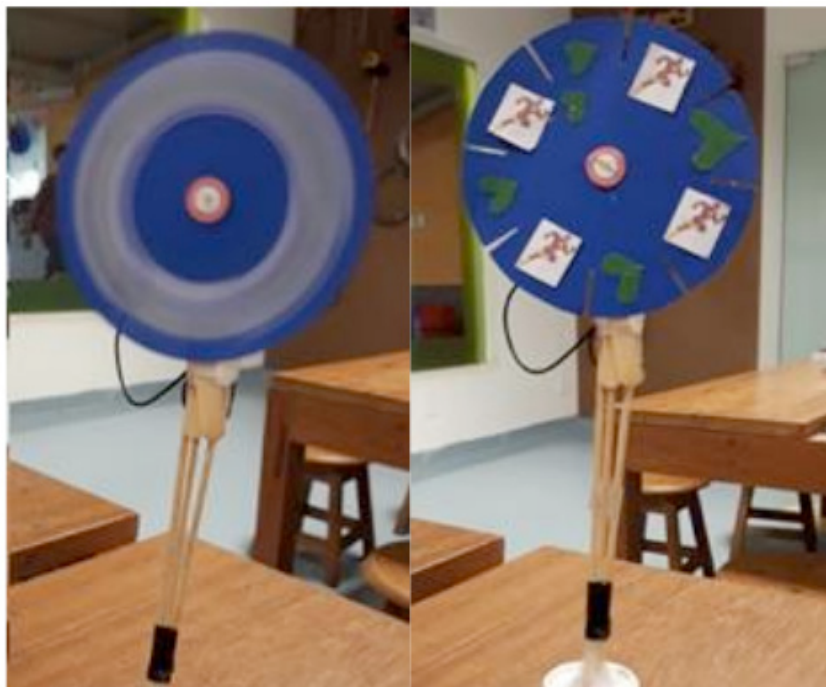
Figura 1. Protótipo para apresentação dos conceitos da Velocidade.

de abordar os conceitos gerais foi possível transmitir aos alunos experiências práticas com desenho geométrico, entendendo o que é raio, diâmetro e centro da circunferência. Os alunos puderam personalizar o seu desenho o tornando único, desenvolvendo sua capacidade criativa.