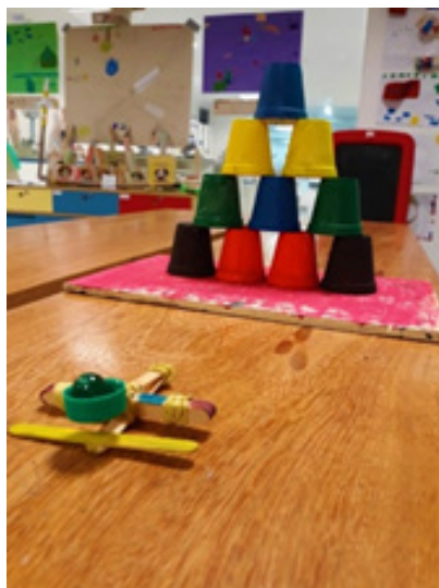
Figura 3. Protótipo confeccionado para apresentação dos conceitos sobre propulsão.