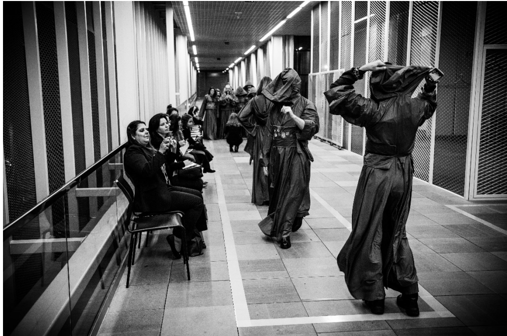
Figura 3: Fluxo de alguns performers se faziam ver.

Tal enquadramento traz à pauta o que se conhece como teatralização, processo de ‘performatividade’ explícita e que consiste em “enfeitar a representação, sem limitar a linguagem, o que acontece pela sobreposição tal de significantes” (BARTHES, 2005) em trânsito, ou significantes flutuantes. É essa condição que torna a língua ou linguagem uma realidade a ser descoberta, ou um sentido que se renova em fluxo.