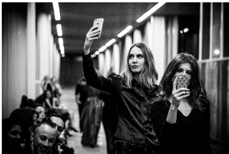
Figura 2: Momento em que alguns performers se faziam ver.

O fluxo de mudanças torna-se perceptível, como uma diáspora líquida, a fluidez é aliada da mudança. E esta transformação não envolve somente móveis e miudezas: ela descompõe a ordem perceptiva das coisas e, dessa forma desordenadamente, também dela mesma. Na mudança se afirma o desejo, porque ao mudar coisas, pessoas, locais e promover o deslocamento constante, favorece-se o sincretismo, as misturas de cultura, de sociedade, de pessoas, de ‘mundos’ diferentes. Nada é permanente.