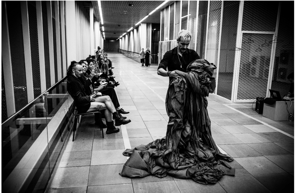
Figura 4: A polifonia do design, estruturas simbólicas e significantes flutuantes.