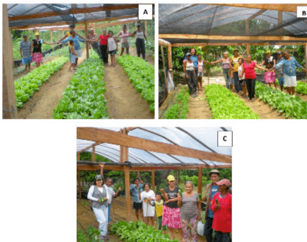
Figura 4. Os participantes próximo à colheita das hortaliças na Unidade de Observação (a e b), com destacada participação das mulheres; na colheita de pepino (c). Manaus, Embrapa Amazônia Ocidental, 2014.