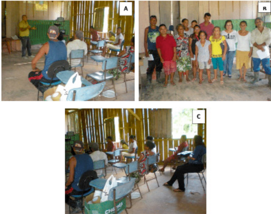
Figura 3. Aspectos do curso “Temas e práticas sobre agricultura orgânica adaptadas às condições da Comunidade Buriti – Tarumã Mirim”. Manaus, Embrapa Amazônia Ocidental, 2014.