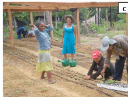
Figura 6. Confeção dos canteiros (a), semeadura em bandejas (b) e transplântio de mudas (c) na Unidade de Observação. Manaus, Embrapa Amazônia Ocidental, 2014.