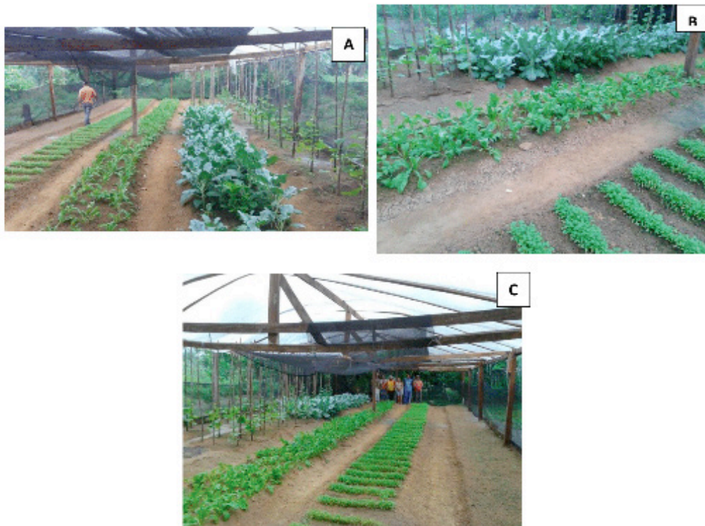
Figura 8. Desempenho agrônômico de algumas das diferentes espécies cultivadas na Unidade de Observação. Manaus, Embrapa Amazônia Ocidental, 2014.