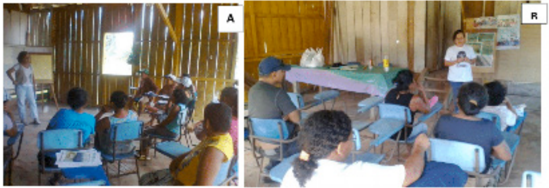
Figura 1. Palestra preliminar (a) e de apresentação do projeto base das ações (b). Manaus, Embrapa Amazônia Ocidental, 2014.