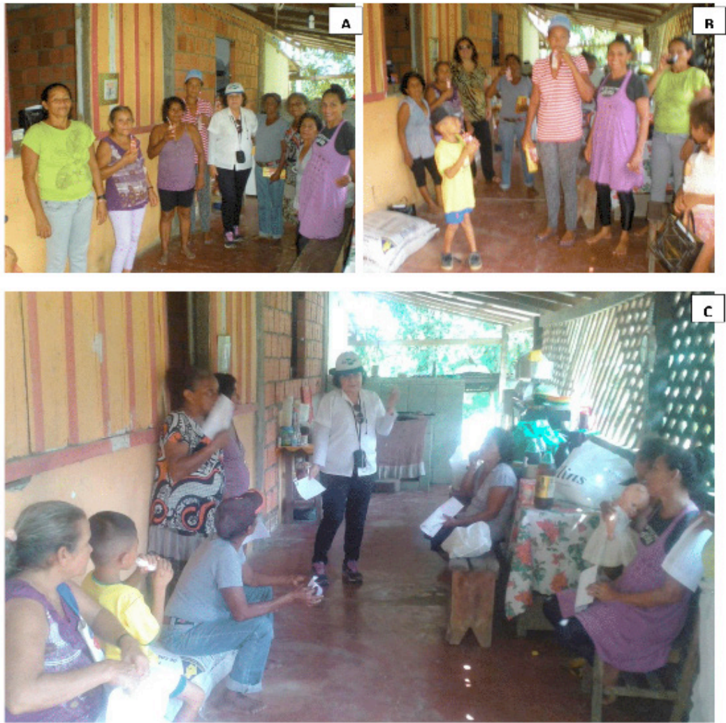
Figura 7. Encerramento das atividades da Unidade de Observação e confraternização. Manaus, Embrapa Amazônia Ocidental, 2014.