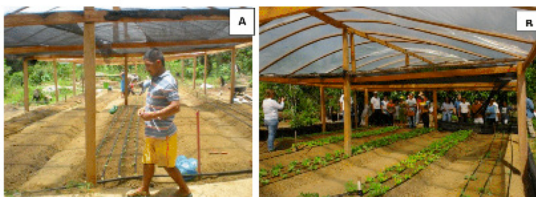
Figura 5. Aspectos da estrutura de cultivo protegido, com sombrite em sua metade. Manaus, Embrapa Amazônia Ocidental, 2014.