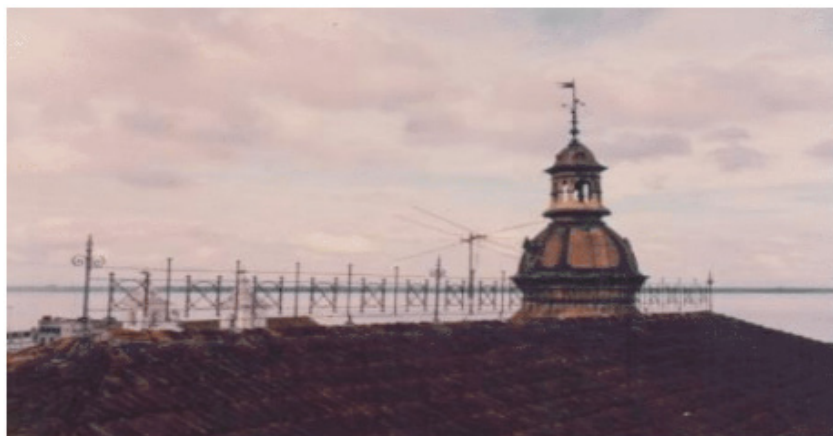
Foto 1: Vista do telhado no prédio Paris N' América, e cúpula da torre do relógio.