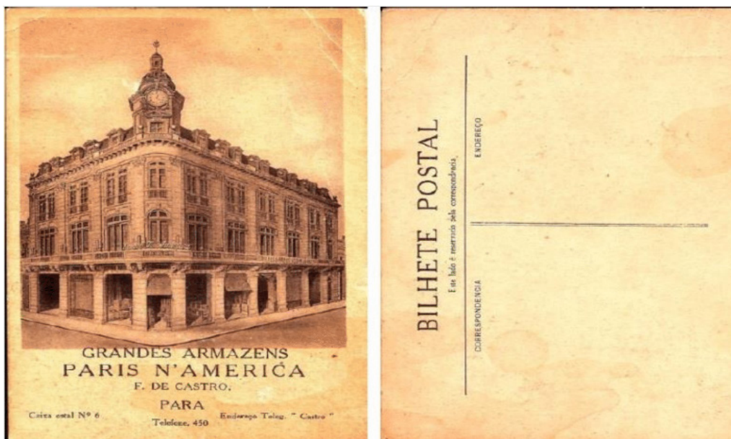
Figura 2: Bilhete Postal do prédio Paris N' América, sem data.