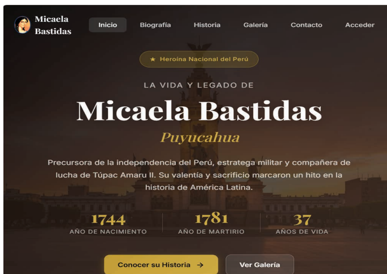
Figura 1 — Sitio web