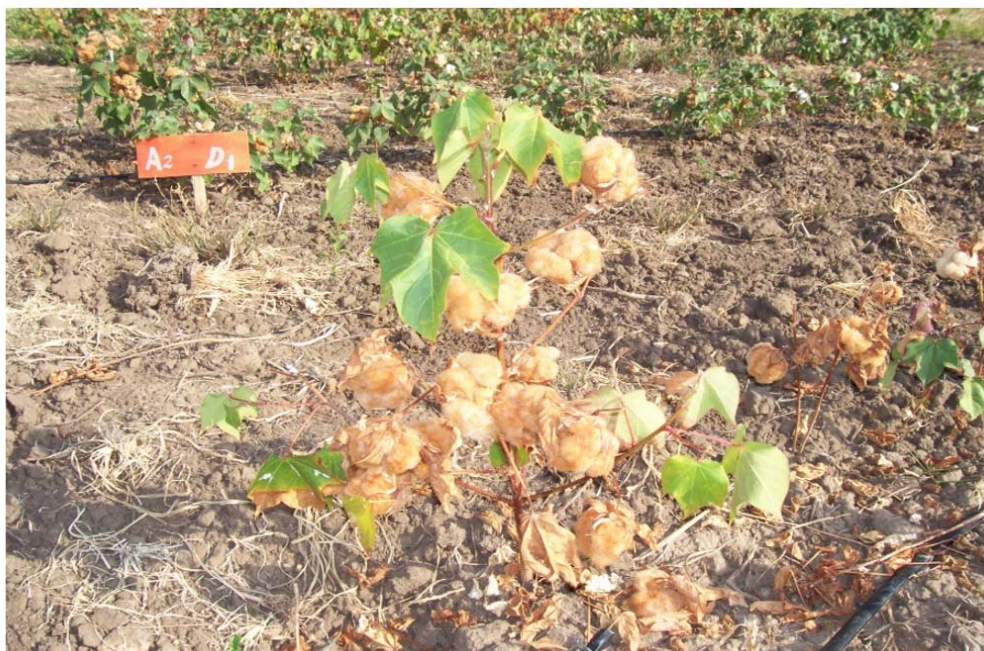
Figura 1. Aspecto geral do genótipo CNPA2002/26, cluster marrom escuro.