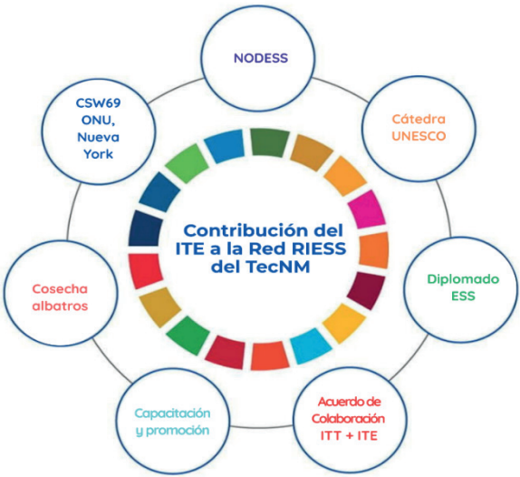
Figura 3. Contribución del ITE a la Red RIESS del TecNM