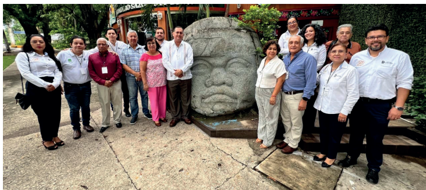
Figura 4: Reunión de la Red RIESS Región Sur de México en Tabasco