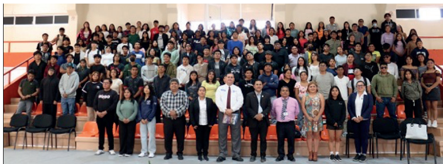
Figura 3: Vinculación de la Red RIESS Región Sur de México en Oaxaca

A partir de lo expuesto, se subraya la relevancia de llevar a cabo un muestreo específico del sujeto de investigación, dado que llevar a cabo una investigación en la totalidad de su población resultaría prácticamente inviable o inaccesible debido al tiempo requerido para su ejecución. Al establecer la muestra de la investigación, se potenciará simultáneamente el grado de calidad de los resultados obtenidos. La QHS es útil porque convierte al cooperativismo y la ESS en actores centrales de la Agenda 2030, no solo como beneficiarios de políticas, sino como arquitectos de un modelo alternativo de desarrollo sostenible. Además, ofrece un ecosistema metodológico para abrir vetas de investigación que integren economía, ética, sostenibilidad y participación ciudadana. En la Figura 2 y Figura 3 se presentan imágenes de los miembros de la Red RIESS Región Sur de México en el Estado de Oaxaca y Tabasco