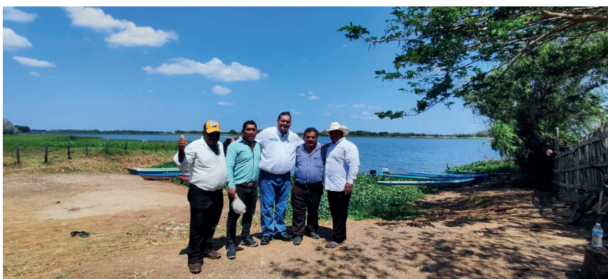
Figura 2: Vinculación de la Red RIESS Región Sur de México en Tabasco

La muestra representa el conjunto mínimo de individuos o entidades, y puede ser también designada como un subconjunto de la población accesible y limitada, a partir de ella. Las razones por las cuales se llevan a cabo investigaciones de muestras en lugar de poblaciones completas radican en el ahorro de tiempo, la optimización de los resultados esperados de las investigaciones, la optimización de los recursos invertidos y la prevención de pérdidas en la investigación, dada la posibilidad de desviar las hipótesis y objetivos de la investigación. En la Figura 1 se presenta imagen del trabajo de vinculación e investigación de campo con el sector de cooperativas pesqueras en el Estado de Tabasco con miembros de la Red de Investigación de Economía Social y Solidaria y Agenda 2030 (Red RIESS) del Región Sur de México.