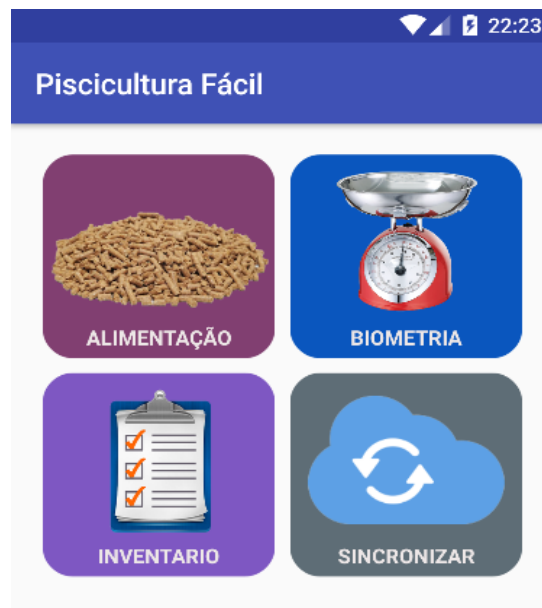
Figura 1 – Tela inicial do software “Piscicultura Fácil”

Os ícones foram dispostos desta maneira para que as funcionalidades sejam de fácil acesso, inclusive para leigos.