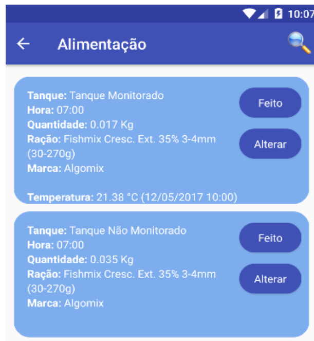
Figura 2 – Alertas de arraçamento

Se o usuário realizar a alimentação como sugerido, basta clicar no botão “Feito”, tendo também a possibilidade de clicar no botão “Alterar, onde o usuário terá a possibilidade de informar manualmente os dados do arraçamento efetuado.