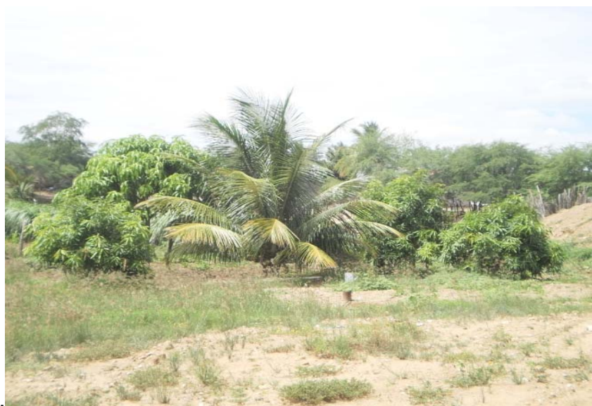
Figura 5 – Cultivo de frutíferas no Sítio Volta do Rio

O proprietário cultiva e preserva matrizes de tamarindo, umbu-cajá, umbu, acerola, caju, coco, manga Maranhão, manga Espada, maracujazeiro amarelo, romã, limão, goiaba, noni, graviola e jaca. A principal finalidade dessas espécies é produzir frutos de qualidades durante todo ano para o consumo da família e para alimentação animal.