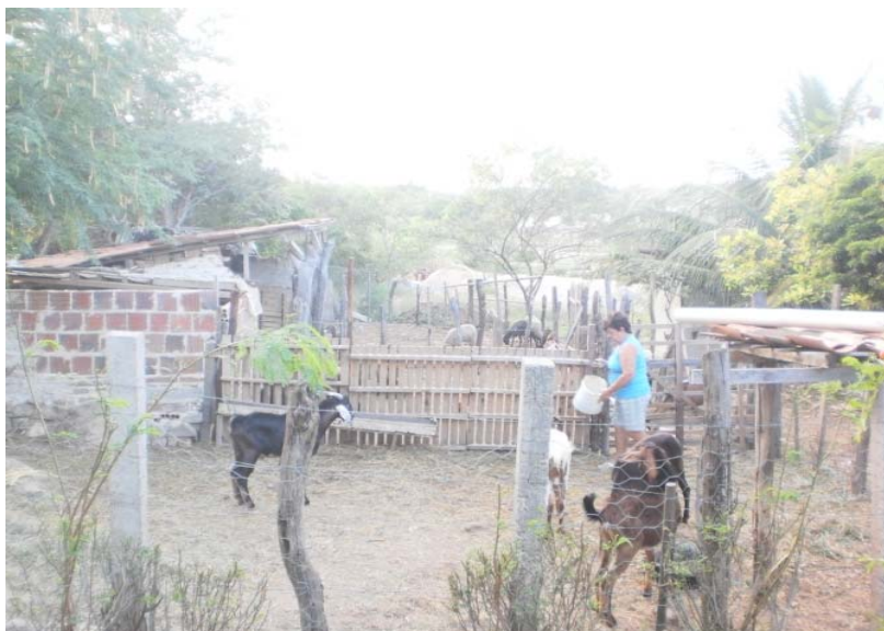
Figura 3 – Criação de caprinos e ovinos no Sítio Volta do Rio.

Os caprinos e ovinos criados no Sítio Volta do Rio são SRD (sem raça definida), adaptados às condições de clima e vegetação da região.