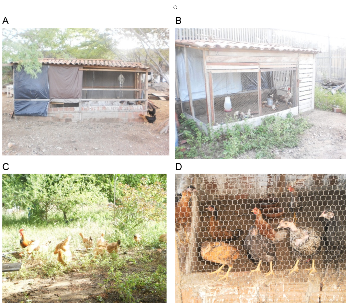
Figura 2 - Criação de galinhas capoeira e caipira no Sítio Volta do Rio no município de Picuí, PB: incubadora e fase de cria (A); galinheiro para recria (B); galinheiro para animais enfermos (C) e animais pastando ao ar livre (D).

Quanto à alimentação das galinhas, esta se dá em dois períodos do dia: milho e/ou ração e restos de alimentos pela manhã e à tarde. Como complemento são servidos vegetais retirados da propriedade.