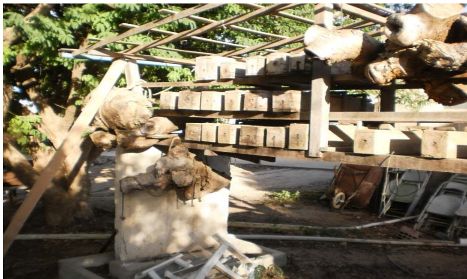
Figura 4 – Criação de abelhas Jandaira no Sítio Volta do Rio

A diferença entre esses dois modelos de nidificação, é que, as abelhas são transferidas do local original para as colmeias racionais, as quais possuem várias divisórias como a tampa, a melgueira, o sobre-ninho, o ninho e o porãozinho. Diferentemente dos cortiços, pois o enxame permanece no local original onde foi nidificado, que geralmente é em troncos de árvores.