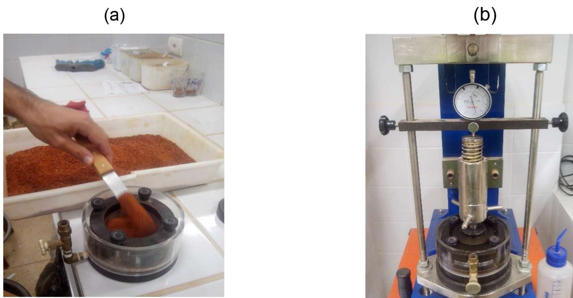
Figura 1: (a) Montagem do corpo de prova na célula de adensamento; (b) Prensa de adensamento.